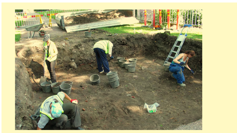
Kuva 2. Arkeologiset kaivaukset Turun Tuomiokirkkopuistossa vuonna 2005.

Pidemmälle arkeologisen perinnön näkyvyydessä päästiin 1980-luvulla, jolloin osaa maasta löydettyistä rakenteista ei purettu rakennustoiminnan yhteydessä, vaan niistä tuli ylläpidettyjä raunioita. Ensimmäinen kohteista oli varhaismodernin Pyhän Hengen kirkon alue kaupungin kirjaston lähellä, jota tutkittiin 1980-luvulla ja muunnettiin yksityiseksi kappeliksi (Kalpa, 2011). Se avattiin vuonna 1992 ja kaivausten löytöihin voi tutustua pienessä näyttelyssä, joka on esillä korttelin halki menevän läpikulkukäytävän joenpuoleisessa päässä, lähellä ulko-ovea. Tätä laajamittaisempi hanke oli 1990-luvulla Aboa Vetus Ars Nova -museon alueelta paljastuneista keskiaikaisista fragmenteista luotu in situ -museo, jonka vetonaulana