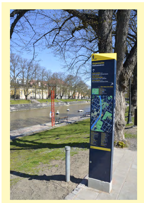
Kuva 3. Opastepyloni Turun keskustassa Aurajoen rannassa vuonna 2020.

alueesta (Immonen et al., 2021). Käsite korostaa kaupungin kansainvälistä luonnetta ja asettaa Turun samalle viivalle niiden länsimaisten kaupunkien kanssa, joilla on kuuluisat historialliset keskukset. Vanhallakaupungilla on sovelluksia mainonnassa ja matkailussa. Termi onkin nopeasti omaksuttu Turun julkiseen puheeseen, ja sen eräs tuore ilmaisu ovat keskustaan vuonna 2020 pystytetyt reittiopasteet eli kartoin varustetut opastepylonit. Ne ovat ulkoasultaan ja värimaailmaltaan lähes identtiset New Yorkin ja Lontoon reittiopasteiden kanssa ja osoittavat Vanhankaupungin alueen Turussa.