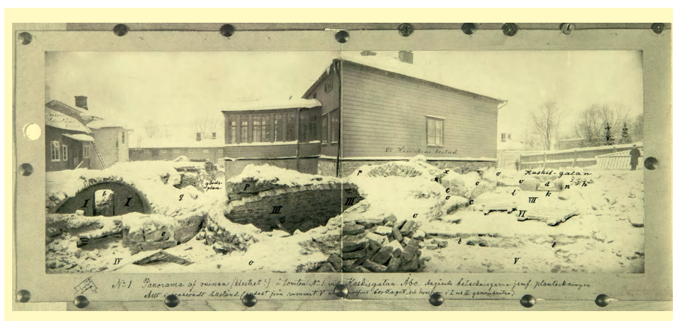
Kuva 1. Panoraamakuva vuonna 1901 Kaskenkatu 1:n tontilta paljastuneista rakennusjäänteistä.

Pitkin 1800-lukua, etenkin vuoden 1827 suurpalon jälkeen, Turun kaupunkialueelta paljastui erilaisissa kaivutöissä jäänteitä muinaisista rakennuksista, mutta vasta vuosisadan loppuvuosina kehkeytyi