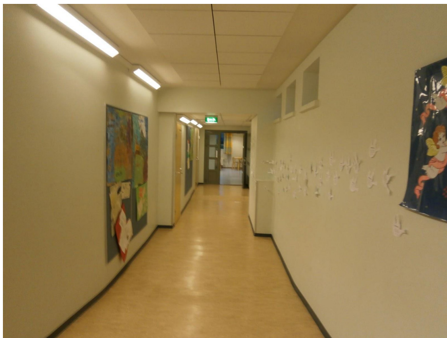
KUVA 3. Suomenkielisen koulun oppilaan ottama kuva käytävältä, joka symboloi hänelle rajaa suomen- ja ruotsinkielisen koulun välillä.

myös symbolisiksi kielirajoiksi oppilaiden puheissa ja toiminnassa (From & Sahlström 2017). Toisaalta näitä rajoja saattaa syntyä myös sellaisilla välituntipihoilla, joissa itsestään selviä materiaalisia, kahden koulun oppilaat toisistaan erottavia rajoja ei ole. Koulujen fyysisiin tiloihin ja niissä liikkumiseen liittyvien käytäntöjen vaikutus kielimaisemien muotoutumiseen on siis moniulotteinen ja ne myös ohjaavat esimerkiksi kielivalintaan liittyviä normeja.