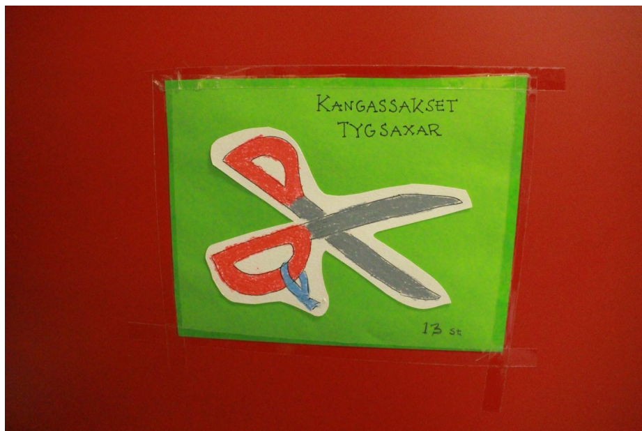
KUVA 4. Kyltti kieliparikoulujen yhteiskäytössä olevassa tekstiilityön luokassa.

Tutkimusten perusteella vaikuttaisi kuitenkin siltä, että kieliparikoulujen kielimaisemille tunnusomaista on joitain poikkeuksia lukuun ottamatta (ks. esim. Helakorpi ym. 2013) kielten säilyminen verrattain erillään. Tähän liittyy myös aiemmin mainittu sosiaalisten tilojen eriytyneisyys eli se, ettei kieliparikoulujen oppilaiden välille näytä kovin helposti syntyvän kontakteja yhteisissä tiloissa (From 2020; Hansell ym. 2016). Myös kielenkäyttöä kieliparikouluissa koskeneet tutkimukset ovat tähän mennessä todenneet, ettei järjestelyllä näytä olevan juurikaan vaikutusta oppilaiden kielenkäyttöön opetuksen ulkopuolella (Sahlström ym. 2013; Hansell ym. 2016). Kielirajat ylittävää opetusta kieliparilukiossa tarkastelleet tutkimukset ovat todenneet, että ”kaksikielisissä” oppilasryhmissä sen sijaan käytetään sekä suomea että ruotsia siten, että samassa keskustelussa käytetään rinnakkain molempia kieliä tai kieliä yhdistetään samassa puheenvuorossa. Lisäksi yhteisenä kielenä saatetaan käyttää englantia. (Hansell & Pilke 2016.) Toistaiseksi tutkimus vahvistaa näkemystä, jonka mukaan kaksikielisten käytäntöjen edistäminen kieliparikouluissa vaatii määrätietoista pedagogiikkaa, eivätkä toimivat kielikäytännöt rakennu pelkästään samoissa tiloissa oleskelemalla.