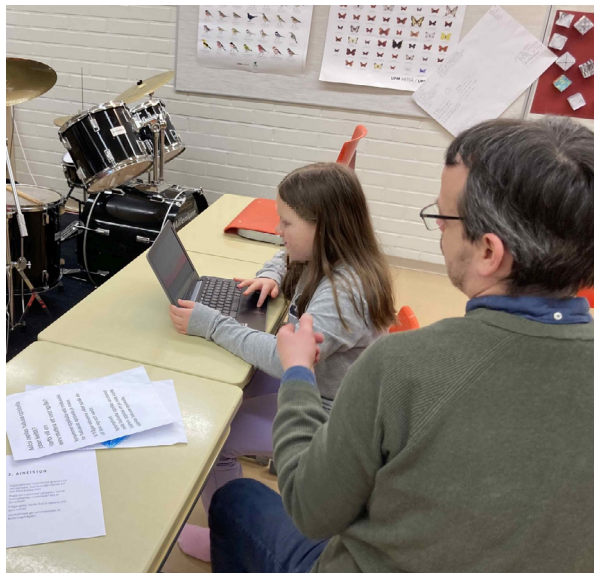
KUVA 2. Luokkahuone semioottisena sommittumana.

Pennycook (2018) painottaa myös semioottisen sommittuman (engl. assemblage ) ja tilallisten kielirepertuaarien merkitystä. Sommittuma käsittää kaikenlaisen samanlaisen toiminnan ja materiaalisen ympäristön sekä siihen osallistuvien kompetenssit ja (keholliset) toimijuudet eli mahdollisuuden osallistua toimintaan. Kuva 2 antaa esimerkin luokkahuoneesta semioottisena sommittumana.