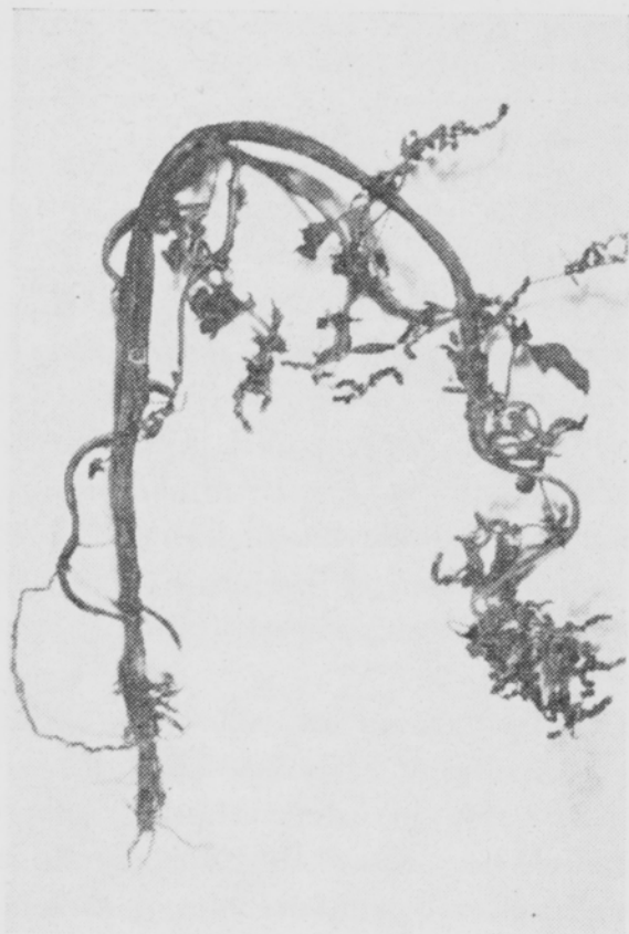
Kuva 3. Hormonikäsittelyn vuoksi käpristynyt jauhosavikka ( Chenopodium album ). Picture 3. A Fat Hen ( Chenopodium album ) curled owing to hormone application.