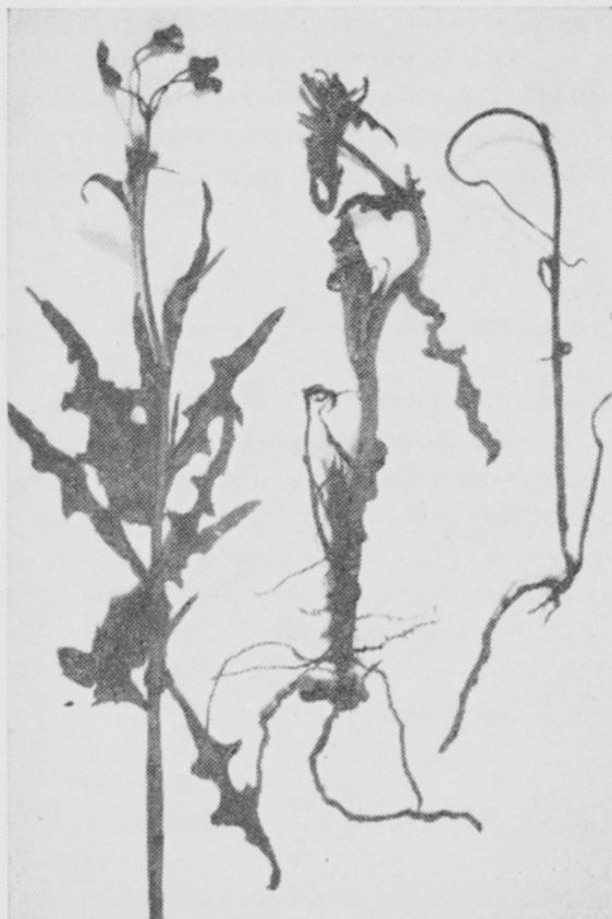
Kuva 2. Kolme peltovalvattia ( Sonchus arvensis ). Vasemmalla terve, keskellä hormonikäsitteystä pahoin kärsinyt, oikealla täydellisesti kuihtunut yksilö.

Koe järjestettiin Järvenpään koulutilan toisen vuoden apila-timoteinurmelle, joka oli jätetty siementymään. Koealueella oli suhteellisen vähän rikkaruohoja, enimmäkseen saunakukkaa ja paimenmataraa. Apila oli jo kukka-asteella ja 50—70 sm:n korkuista, timotei siemenasteella ja 120—140 sm:n mittaista. Koerudut olivat 50 m 2 :n suuruiset ja kertausrudut kaksi. Hormonivalmisteet (Agroxone-pölyte 200 kg/ha ja 2—4 Dow Weed Killer-ruiskute 0,1%, 1500 litr./ha) levitettiin 12/7 ja Weedone-ruiskute 1 : 100, 2200 litr./ha, 31/7. Havainnot suoritettiin 24/7 ja 7/8. Tällöin voitiin todeta sekä puna- että alsikeapilan kärsineen hormonikäsitteystä siten, että osa lehdistöä lakastui ja ruskettui ja varret olivat muuttuneet mutkaisiksi. Timotei ei kärsinyt käsitteystä. Rikkaruohoista saunakukan ja sian kärsämön varret mutkistuivat ja paimenmataran, voikukan, kotihierakan, hiirenvirnan ja arohumalan lehdet lakastuivat osittain. Weedonen vaikutus oli sen myöhäisestä levityksajasta huolimatta voimakkaampi kuin toisten valmisteiden.