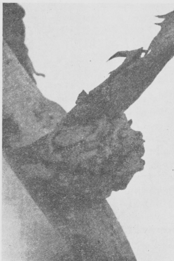
Kuva 4. Hormonikäsittelyn aiheuttama epämuodostuma peltovalvatin ( Sonchus arvensis ) lehtihangassa.