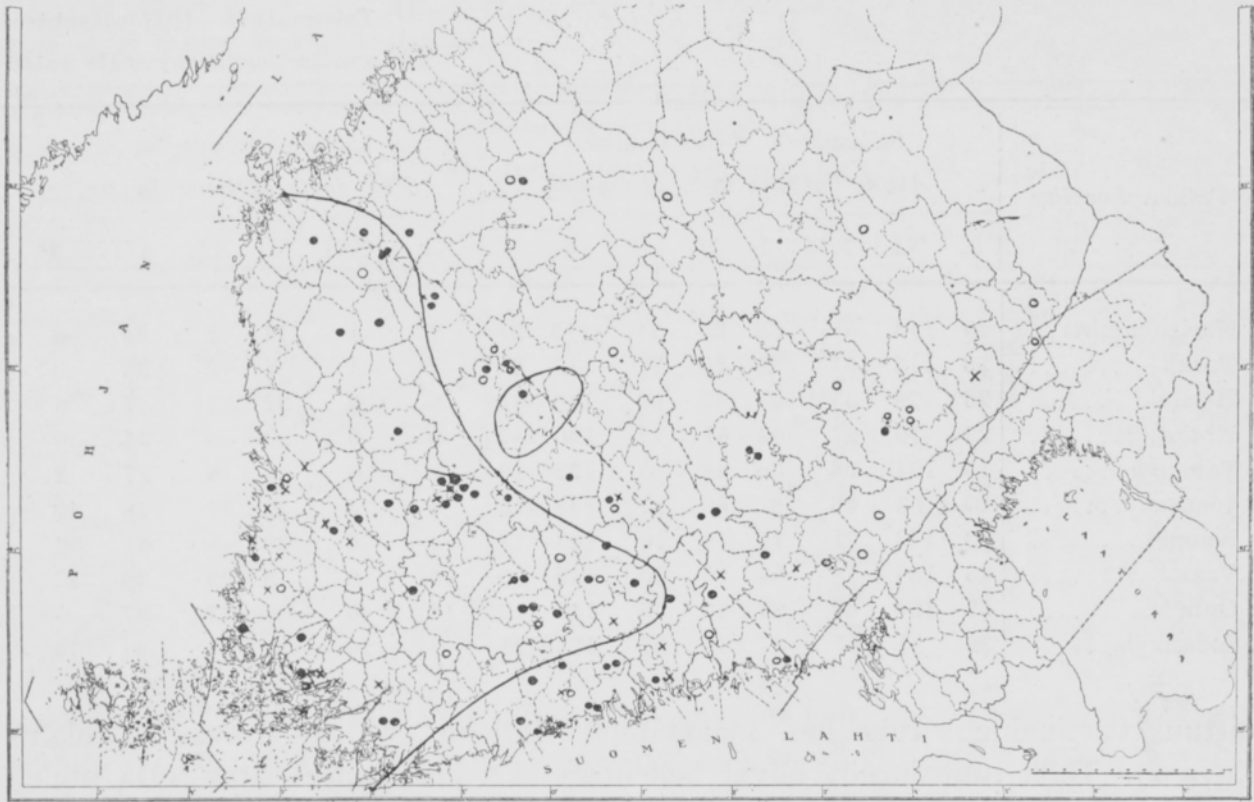
Kuva 2. Paikkakunnat, joilla talven vahinkoja on havaittu.