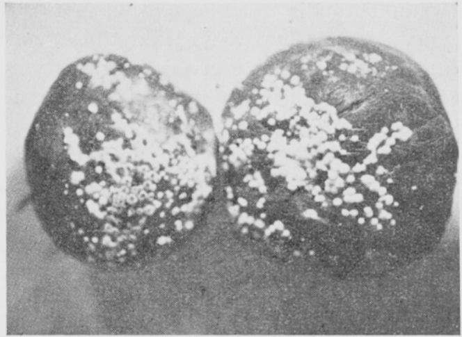
Kuva 1. Monilinia fructigenan turmelemia Astra-kaani-omenia. Orig. — Fig. 1. Apples rotted by Monilinia fructigena . Variety Astrachan. Orig.

koepuut olivat 4-vuotiaita, suoritettiin saastutuskoe siten, että kaikkiaan 65 hedelmää inokuloitiin viemällä M. fructigenan kuromia veitsen kärjellä hedelmien kuoreen tehtyihin haavoihin. Kaikki hedelmät saastuivat tällöin. V. 1949 inokuloitiin hedelmät 26 p. elokuuta siten, että M. fructigenan vastikään saastuttamien omenien pinnasta otettiin kuromia ja siveltiin niitä terveiden ja eri tavoin vioittuneiden hedelmien pintaan. Inokulointitavat sekä saastuntatulokset vuoden 1949 kokeesta esitetään taulukossa 1.