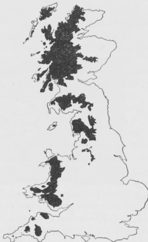
Kuva 2. Britannian sadekartta. Yli 1200 mm vuotuinen sademäärä merkitty tummalla. Distribution of rainfall in the British Isles. Areas with over 50 inches of rainfall per annum shown in black.