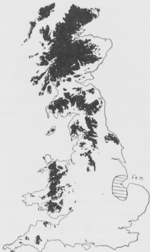
Kuva 1. Soiden levinneisyys Britaniassa. Moorlands in the British Isles.