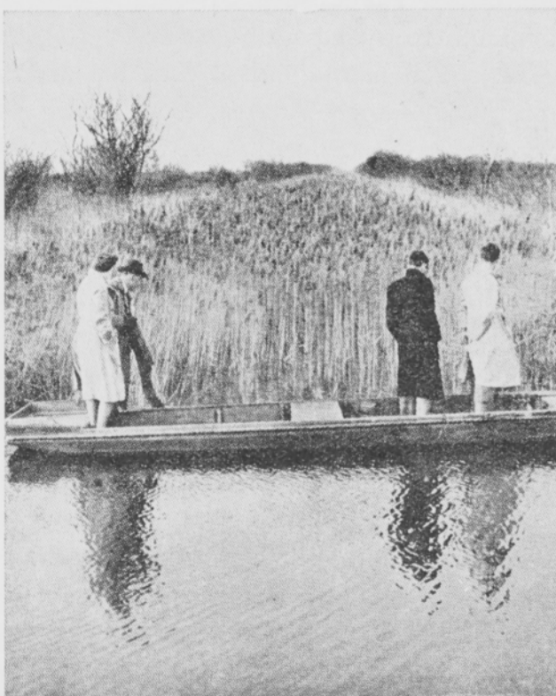
Kuva 7. Luontaista fensuota Wicken fenin luonnontilassa.

Luontaisen fensuon pintakasvillisuutta en ollut tilaisuudessa näkemään. Aikaisemmin mainitulla Wicken fenillä voidaan GODVININ ja BHARUCHAN (5) mukaan erottaa seuraavat kasviyhdykunnat: 1) Phragmites -kasvustot, 2) puhtaat saraikot ( Cladium -kasvustot), 3) pensasvyöhyke ( Rhamnus frangula ja R. cathartica ), 4) Rhamnus -korvet,