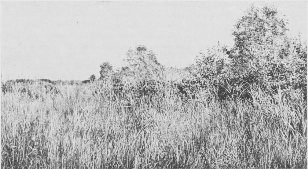
Kuva 8. Metsittyvä fensuo. — Developing carr. Phragmites , Juncus subnodulosus , Myrica gale , Fraxinus excelsior , Betula pubescens , Salix atrocinnerea .

joissa joko voi olla tai josta puuttuu Cladium -kasvillisuus. Edellä mainittu järjestys osoittaa kasviyhdyksuntien sijaintia kosteimmasta kasvupaikasta kuivimpaan. Pohjaveden korkeudesta ja sen vaihteluista eri kasviyhdyksuntien kohdalla esittää GODVIN yksityiskohtaisia havaintoja. Wicken fenilläkään ei soiden luontainen kasvillisuus ole voinut kehittyä häiriintymättä, vaan puiden hakkuu ja heinäniitto ovat paikoin estäneet korpivaiheen synnyn. Mainittakoon, että saransekaisia kasvustoja, joissa Cladium mariscus ja Molinia coerulea ovat vallitsevia, niitetään joka 4—5 vuosi, mutta puhtaita Molinia -kasvustoja joka toinen vuosi. Phragmites on edelleenkin erittäin yleinen laji ojissa ja paikoin jopa pelloillakin. On luonnollista, että näiden soiden aikaisempi pintakasvillisuus on ollut lajirikasta ja rehevää. Itä-Englannin fensoiden pinnalle ei ole ehtinyt muodostua rahkapeitettä. Tämä johtunee pohjaveden laadusta sekä ennen kaikkea sen korkeudesta tämän alueen ollessa luonnontilassa. Toisaalta myöhemmin toimeenpantu kuivatus lienee ollut siksi tehokas, että rahkoittumista ei ole voinut tapahtua. Ehkäpä silloin tällöin ryöstäytymään päässeet vedet ovat omalta osaltaan myös estäneet rahkasammalien valtaan pääsyä.