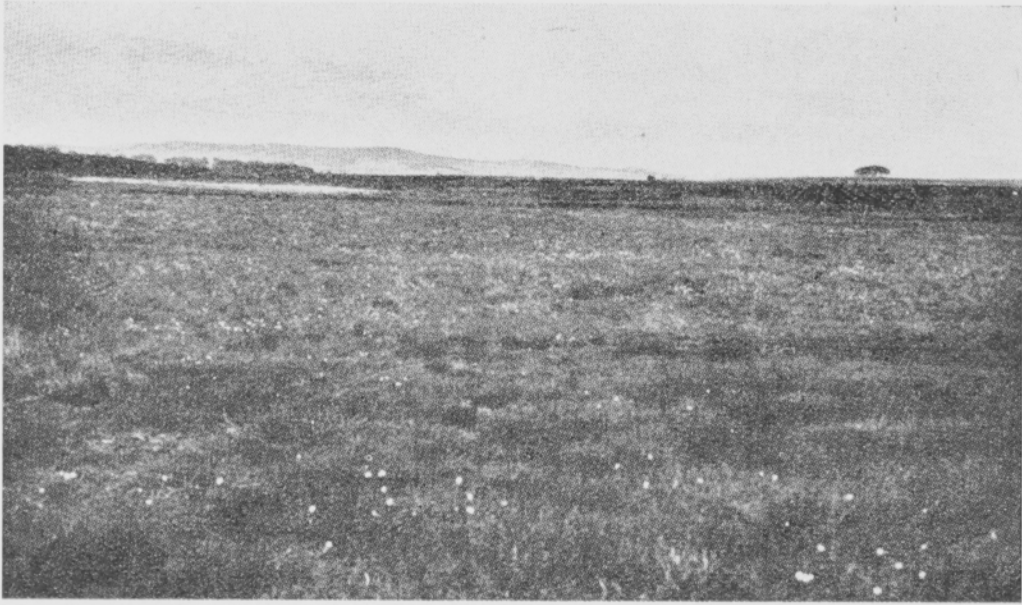
Kuva 3. Tupasvillasuo — Eriophorum vaginatum moss. Red moss at Parkhill, north of Aberdeen.