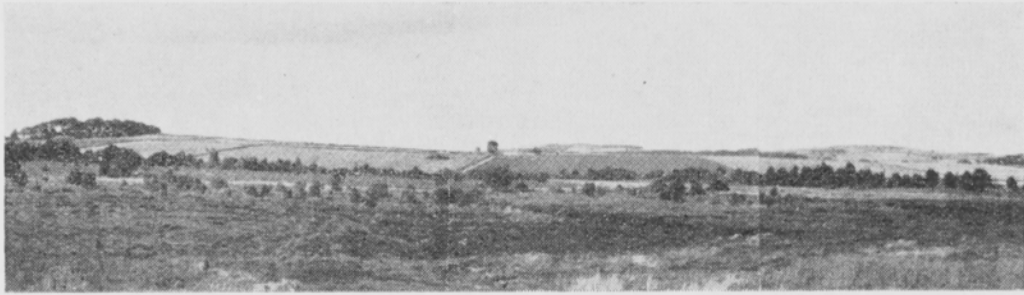
Kuva 5. Oligotrofinen laaksosuo. An oligotrophic valley moss. Strichon moss, north of Aberdeen.

2 m syviä. Paikoin turpeen ottoa on suoritettu kahdessa tasossa ja suon pinnalle on täten muodostunut pienehköjä, selvästi näkyviä saarekkeitä.