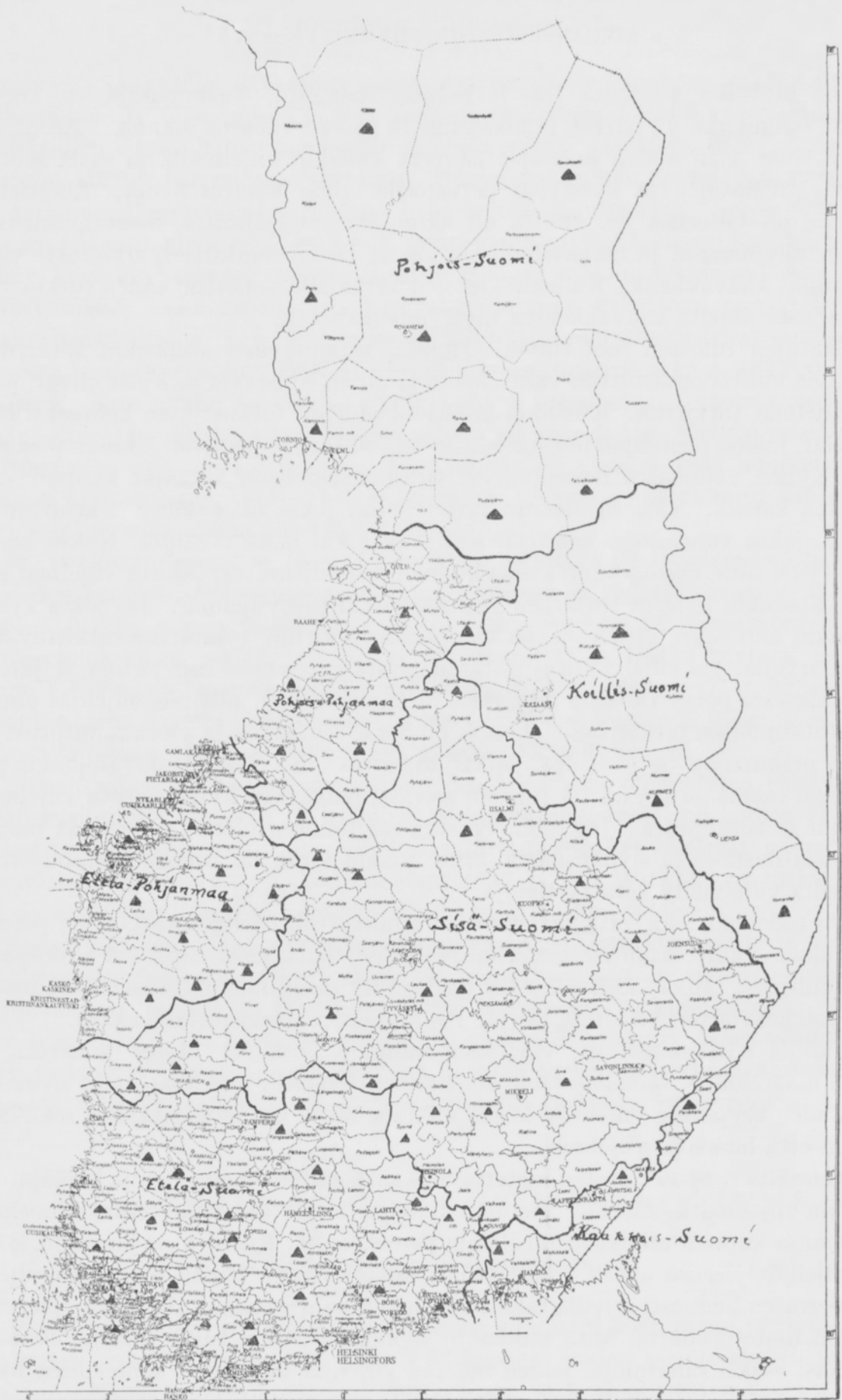
Kartta tutkimusalueesta ja tutkituista kunnista. ▲ = kunta, jonka pienviljelmää tutkittu. Kartasta puuttuvat Neuvostoliitolle 19. 9. 1944 luovutetut kunnat.