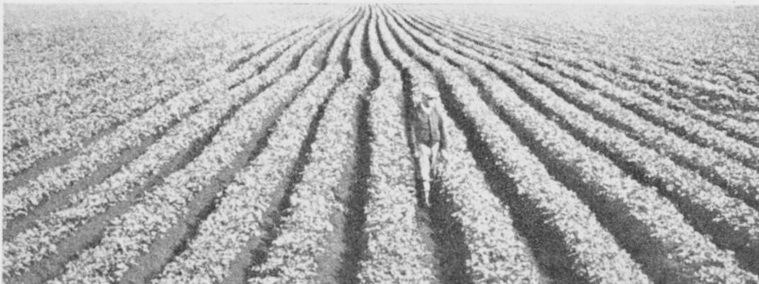
Kuva 5. Vihannesten viljely on hyvin yleistä ja laajaa kaikkialla Yhdysvaltain soilla.

Turpeiden melko suuresta tuhkapitoisuudesta ja täydellisestä maatuneisuudesta johtuen niiden tilavuuspaino on erittäin korkea. Typpipitoisuus on itse asiassa verraten alhainen. Kalkkia on jokseenkin aina runsaasti. Cladium-turpeet ovat selvästi pintaosissaan liejuja happamampia. Turvekerrosten painuminen on sikäläisissä olosuhteissa erittäin voimakasta. Se johtuu ensinnäkin suon suuresta