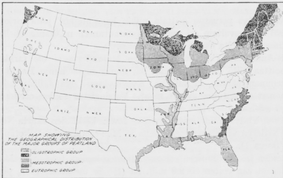
Kuva 1. Yhdysvaltain soiden levinneisyys DACHNOWSKY-STOKESIN mukaan.

Laajoja suoosiintymiä on edelleen Virginian ja Karolinan rajaseuduilla ja Georgiassa . Hyvin huomattava, yhtenäinen suoosiintymä, Everglades, on etelä-Floridassa . Sen laajuus on n. 770 000 ha. Lisäksi pieniä suoosiintymiä on muual- lakin Floridassa. Mississippi -joen varsilla, Kaliforniassa , Oregonissa ja Washingto-