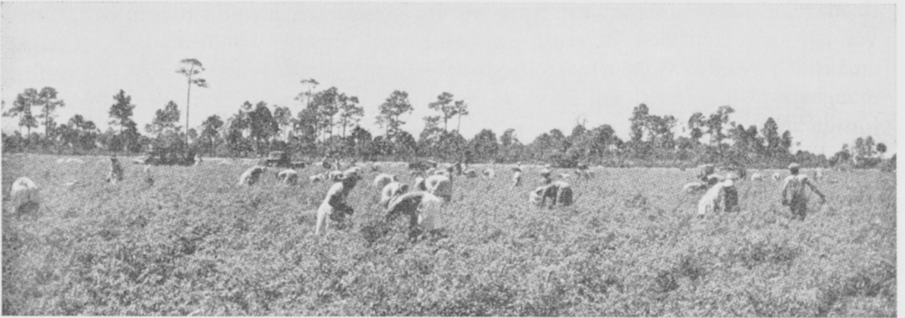
Kuva 6. Pavun korjuuta Floridan Everglades-alueella.