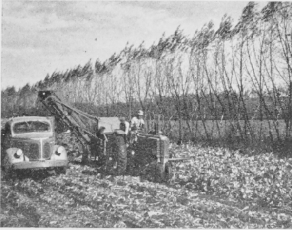
Kuva 8. Pajusuoja-aidoilla estetään soiden ero- siota. Etualalla sokerijuurikkaan koneellista nos- toa. Michigan.

runsaasti kokeiltu. Vihreätä puumaista pajua käytetään yleisesti näihin aitoihin. Se kasvaa nopeasti ja tällaiset aidat ovat usein 8—10 m korkeita (kuva 8). Aitojen etäisyys toisistaan on n. 250 m. Paitsi pajua on Michiganissa kokeiltu myös havupuita, joista saadaan kyllä tehokas aita, mutta se kasvaa hitaasti. Ainakin koetarkoituksiin on myös käytetty tavallisia lumiaitoja, jopa on kokeiltu purjekankaallakin. Floridan laajoilla suoalueilla on teiden varsille istutettu Itävallan mäntyä tai paikoin bamburuokoa.