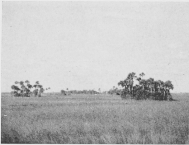
Kuva 3. Floridan Everglades-nimisellä laajalla suoalueella on Cladium leimaa-antava laji. Saarekkeilla kasvaa kookospähkinäpuita.

mainittujen oligotrofisten soiden eteläpuolella alueella, jonka eteläraja noudattelee maajään ulointa rajaa. Täten niitä on etenkin Ohiossa, Indianassa, Illinoisissa, Michiganissa, Wisconsinissa, Minnesotassa ja Iovassa. Ne soveltuvat hyvin monipuoliseen kasvintuotantoon ja niiden taloudellinen arvo on tämän takia erittäin huomattava.