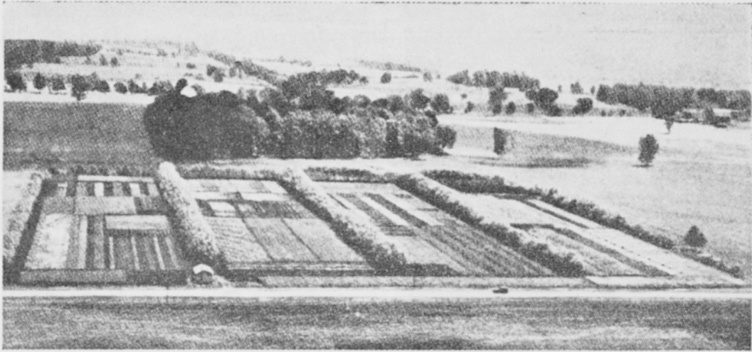
Kuva 7. Suokoeasema lähellä East Lansingia Michiganissa.

Ryhmissä 5. ja 6. on asetelmassa mainittujen kerrosten välissä lievemmin hapanta turvetta. Joskaan merkelipohjaiset suot eivät yleisesti ole kalkituksen tarpeessa, niin eräissä tapauksissa ei niistä ole ilman kalkitusta saatu tyydyttäviä satoja. Kuparilannoitus on myös hyödyksi.