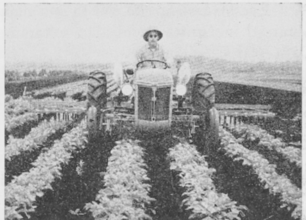
Kuva 4. Koneellistettua vihannesten viljelyä Michiganissa.

Everglades sijaitsee hyvin matalalla. Niinpä ennen kuivattamista suon pinta Ockechobee-järven luona oli vain 6 m meren pinnan yläpuolella. Suo on hyvin tasainen (kaltevuus pohjoisesta etelään on vain 4 cm/km.). Sen molemmin puolin on laajoja, mataloita hiekkakankaita. Suurin osa turvekerrostumista sijaitsee kalkkikiven tai kalkkipitoisen merkelin päällä. Turvekerrosten paksuus vaihtelee melkoisesti. Pohjoisessa lähellä Ockechobee-järveä saattaa olla 3—3½ m turvetta, mutta suon reunamilla vain muutamia kymmeniä senttimetrejä. Ennen viemäröintiä ja Ockechobee-järven patoamista koko suoalue usein joutui tulvan alle,