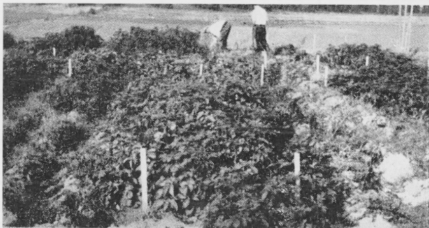
Kuva 1. Aquila peruna Viikin koetilan kokeissa v. 1949

Aquila-perunan yllättävä sairastuminen Jokioisissa viittaisi myös mahdollisuuteen, että siellä olisi päässyt valtaan tavanomaista patogenisempi perunarutto-