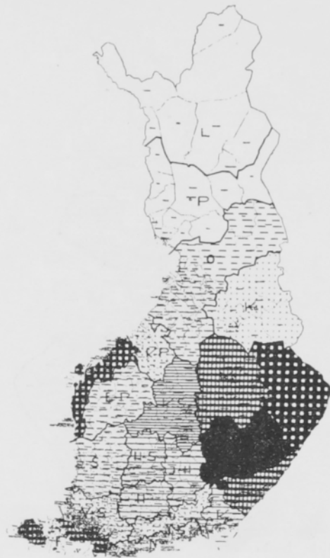
b. Upto Uptodate