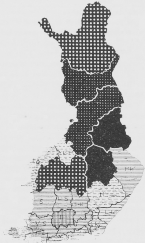
b. Vesijärvi Harbinger