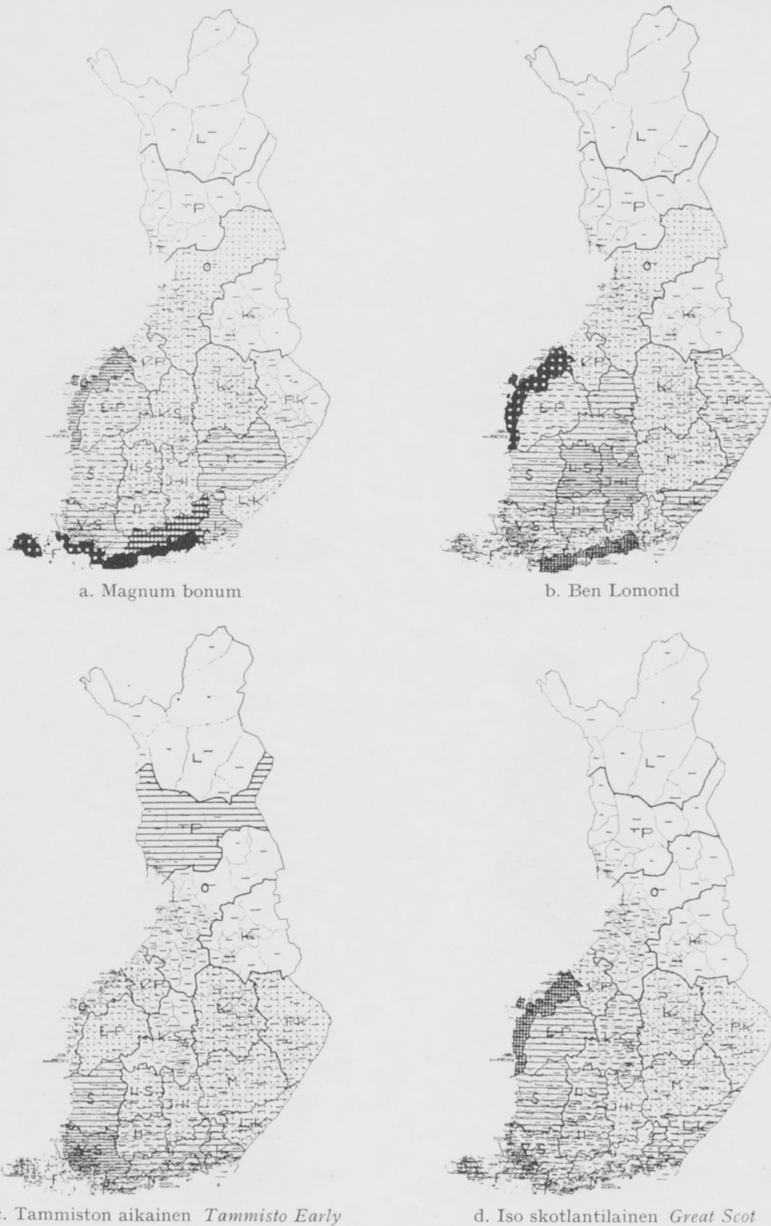
Piirros 3. a) Magnum bonumin, b) Ben Lomondin, c) Tammiston aikaisen ja d) Ison Skotlantilaisen viljelyalat %:issa perunan koko viljelyalasta maanviljelysseuroittain vuonna 1950. (Vrt. karttaselostukseen piirroksessa 4.)