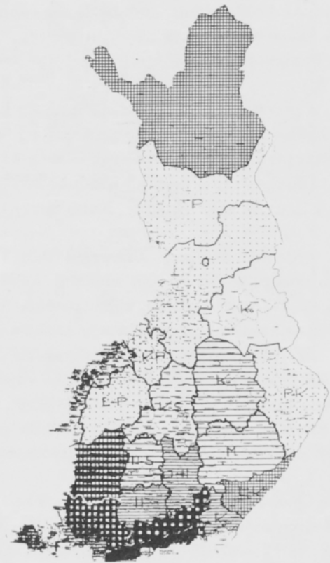
d. Kuningas Yrjö King George

Piirros 1. a) Ruusulehden, b) Vesijärven, c) Eigenheimerin ja d) Kuningas Yrjön viljelyala %:issa perunan koko viljelyalasta maanviljelysseuroittain vuonna 1950. (Vrt. karttaselostukseen piirroksessa 4.) Fig. 1. Percentages of the potato area under varieties a) Rosafolia , b) Harbinger , c) Eigenheimer and d) King George according to agricultural societies in 1950. (Obs. the notes in the Fig. 4.)