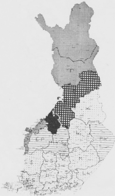
c. Laivaperuna Obenwälder Blaue