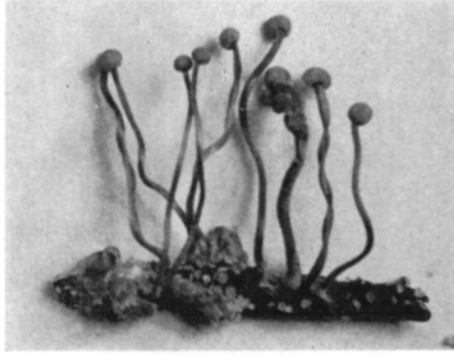
Kuva 1. Itänyt D_1 -torajyväkannan sklerotio.