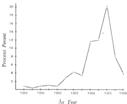
Fig. 1. Alkyl-(metyl-)preparatens andel (%) av saluförda kvicksilverbetningsmedel 1956-1968 enligt mängden aktiv substans.