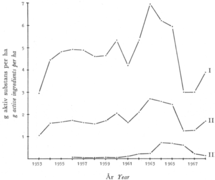
Fig. 3. Betningskvicksilver tillfört odlingsjordarna 1953-1968: g aktiv substans per ha (I) stråsäd och (II) odlingar samt (III) alkyl-(metyl-)kvicksilver per ha stråsäd.

substans per ha och år, varierande från 2.9 g 1953 till 6.9 g 1963 (fig. 3). Motsvarande värden för den sammanlagda odlingsarealen utgjorde 1.8 g respektive 1.0—2.7 g. Av denna mängd var alkylkvicksilvrets andel endast 5 %. Fördelat på arealen av stråsäd var jordtillskottet av alkylkvicksilver 1956—68 i medeltal 0.25 g (0.02—0.7 g) per ha och år, och fördelat på den totala odlingsarealen 0.1 g (0.005—0.3 g). Kretsloppet och omsättningen av det kvicksilver, som genom betat utsäde tillförs jorden, är tillsvidare nästan helt outforskade.