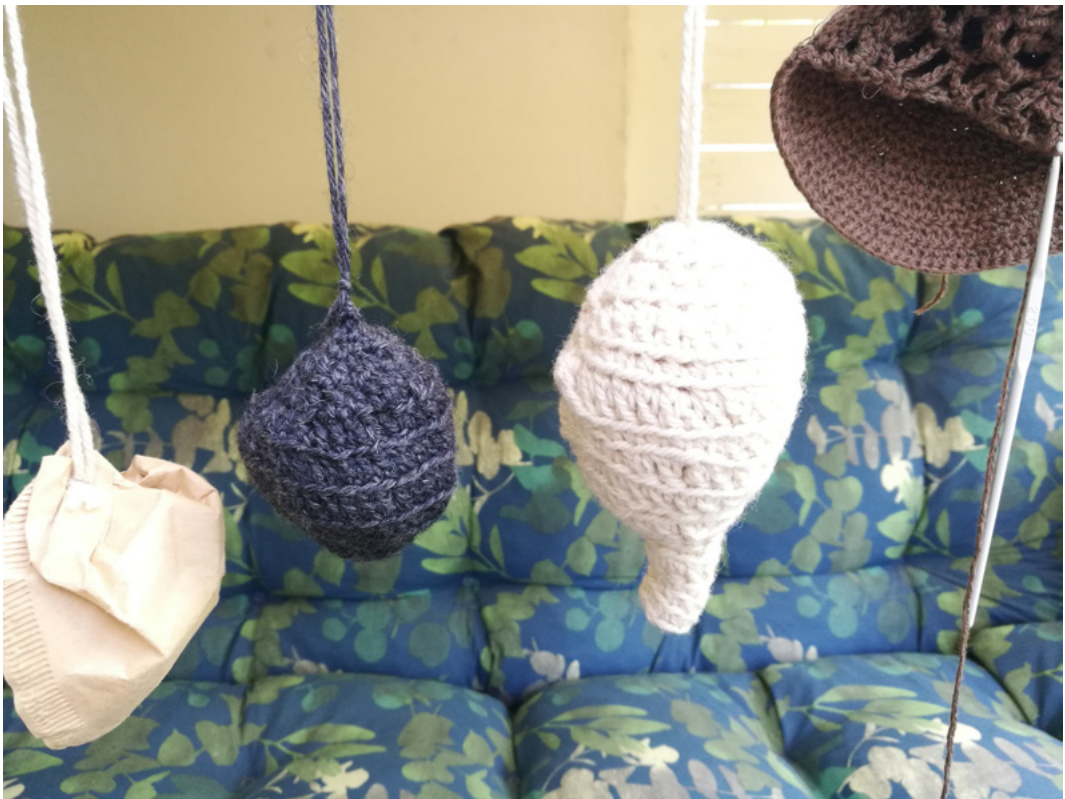
Kuva 1. Autoetnografiseen työskentelyyn kuului valespesien virkkaaminen kokeilevalla otteella.

”Tajusin, että valespesä neuvotaan ohjeissa virkkamaan väärin päin, alhaalta ylös. Tämä on kätevää, koska aloituslangan voi jättää pesän sisälle, ja lopetuslangasta saa tehdyksi ripustuslenkin. Mutta ampiaiset tietenkin aloittavat roikkuvan pesän rakentamisen ylhäältä, kohdasta josta pesä kiinnittyy räystäääseen, tai minne sen nyt rakentavatkaan. Siksi virkkasin toisen valespesän ylhäältä aloittaen. [-] Koin tarvetta tehdä ampiaisten näkökulmasta oikein. Toiseen villalankapesään virkkasin muuttaman epätasaisen, kohollaan olevan kohdan. Näin hain valespesään tekstuuria ja elävyyttä, kuten