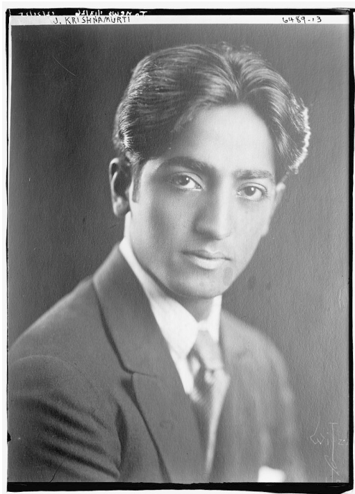
Intialainen ajattelija Jiddu Krishnamurti vuonna 1900.

Krishnamurti pyrkii ylittämään sanat ja ajattelun. Tietysti joudumme käyttämään kumpaakin arkielämässämme, mutta sanat eivät ole varsinainen tie ”totuuteen”, jos sitä edes on olemassa. Mitä sitten seuraa, jos oivallamme, etteivät sanat kerro esitettyä