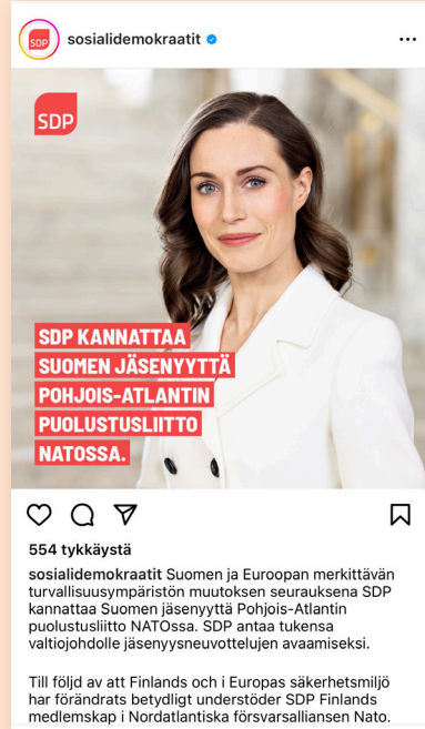
Kuva 7. Tilin @sosialidemokraatit Instagram-julkaisu 14.5.2022, jossa lainataan Sanna Marinin lausuntoa Suomen itsenäisyyden turvaamisen tärkeydestä.