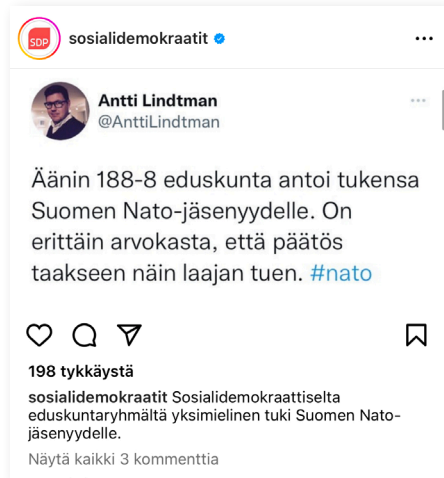
Kuva 10. Tilin @socialidemokraatit Instagram-julkaisu 17.5.2022, jossa ilmoitetaan eduskunnan päätöksestä hyväksyä Suomen Nato-jäsenyys.

painottua kysymys Suomen turvallisuudesta (KOK, 27.4.2022, 30.4.2022, 11.5.2022; PO 19.3.2022; SDP 13.4.2022, 1.5.2022, 14.5.2022, 16.5.2022; SM 2.4.2022, 1.5.2022) ja rauhasta (KOK 1.4.2022, 4.4.2022, 8.4.2022, 12.4.2022, 25.4.2022, 27.4.2022, 16.5.2022). SDP julkaisee 14. toukokuuta kuvan Marinista ja kannanotosta: ”Tehtävämme on kaikissa tilanteissa turvata Suomen itsenäisyys, koskemattomuus ja suomalaisten mahdollisuus elää elämänsä turvallisesti ja rauhassa” (kuva 7).