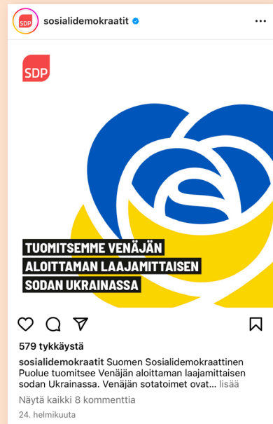
Kuva 2. Tilin @sosialidemokraatit Instagram-julkaisu 24.2.2022, jossa Venäjän aloittama sota tuomitaan.