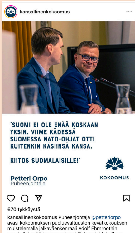
Kuva 8. Tilin @kokoomus Instagram-julkaisu 14.5.2022, jossa lainataan Petteri Orpon lausuntoa "kansan" halusta liittyä Natoon.