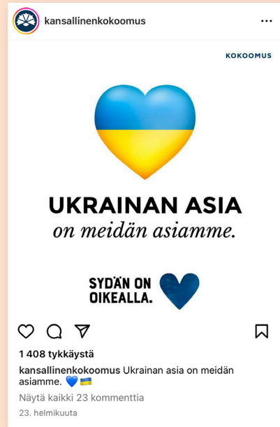
Kuva 1. Tilin @kokoomus Instagram-julkaisu 23.2.2022, jossa todetaan, että ”Ukrainan asia on meidän asiamme”.

Hyökkäyksen aloituspäivänä SDP julkaisi vastavanlaisen kuvan, jossa puolueen ruusulogo oli saanut sinikeltaisen väriänsä (ks. kuva 2 ). Ruusu, ”perinteinen kansainvälinen työväenliikkeen symboli” (SDP 2020), yhdistyy kuvassa valkoiseen tekstiin mustalla taustalla: ”Tuomitsemme Venäjän aloittaman laajamittaisen sodan Ukrainassa.”