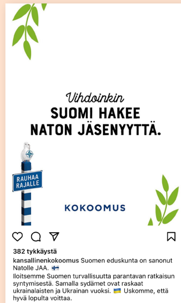
Kuva 9. Tilin @kokoomus Instagram-julkaisu 17.5.2022, jossa kommentoidaan Suomen Nato-hakemusta.