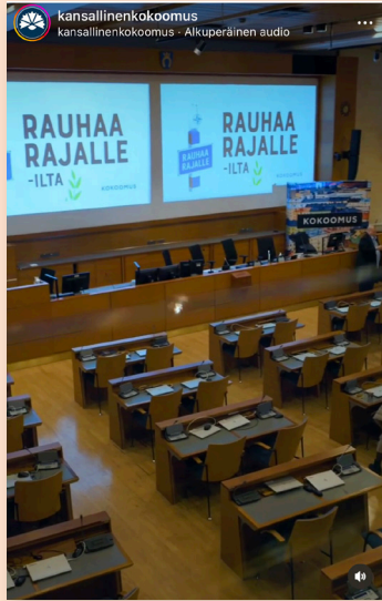
Kuva 6. Tilin @kokoomus Instagram-julkaisu 5.4.2022, koostevideo "Rauhaa rajalle" -kiertueen seminaarista Vantaalla, kuvassa videon aloituskuva.