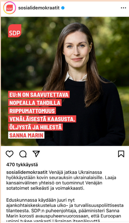
Kuva 5. Tilin @sosialidemokraatit Instagram-julkaisu 15.3.2022, jossa muun muassa otetaan kantaa EU:n energiaturvallisuuden vahvistamisen puolesta.

Toinen suomalainen muistopäivä liitetään Ukrainan tilanteeseen SDP:n julkaisussa 13. maaliskuuta (ks. kuva 4 ). Sen kuvaosio on kuvakaappaus Marinin Twitter-julkaisusta, jossa todetaan: ”Talvisodan päättymisen muistopäivänä ajatukset ovat suomalaisissa, jotka uhrasivat henkensä isänmaan vuoksi. Olemme heille paljon kiitollisia. Tänäpäin Ukrainassa taistellaan itsenäisyyden säilyttämiseksi. Uhraukset ovat kovat. Ajatuksemme ovat yhtäläillä heidän kanssaan.”