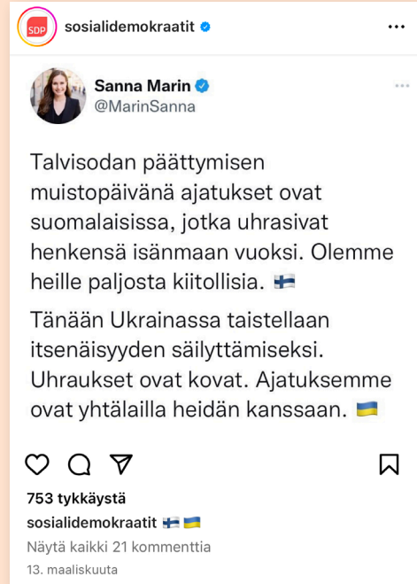
Kuva 4. Tilin @sosialidemokraatit Instagram-julkaisu 13.3.2022, jossa talvisodan muistopäivän johdosta kiinnitetään huomiota "uhrauksiin" Ukrainassa.

Tarkasteluajanjaksona kaikilla tarkastelluilla tileillä Ukrainan tukeminen tuodaan toistuvasti esiin poliittisena vaihtoehtona (KOK 28.2.2022, 3.8.2022, 8.4.2022, 17.5.2022; SDP 5.3.2022, 8.4.2022, 15.3.2022, 8.3.2022, 30.4.2022, 3.5.2022; SM 26.2.2022, 28.2.2022, 23.3.2022). SDP:n ja pääministeri Marinin tileillä lisäksi toistuvasti tuomitaan Venäjän hyökkäys (SDP 15.3.2022, 9.5.2022; SM 24.2.2022, 1.3.2022, 11.3.2022).