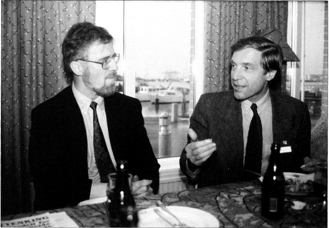
Ministeri Gundmund Hernes Norjan kirkko-, opetus- ja tutkimusministeriöstä sekä Pohjoismaiden Ministerineuvoston pääsihteeri Pär Stenbäck keskustelivat kvalifikaatiokysymyksistä joulukuussa NFA:ssa pidetyssä Tulevaisuuden aikuiskoulutus-konferenssissa.