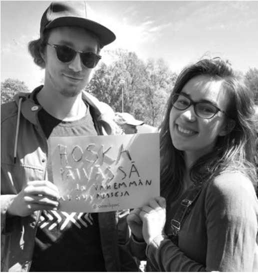
Maailma kylässä -kaupunkifestivaalin kävijä kirjoivat pahville lupauksia paremman Suomen puolesta.

lupausten sisältöön. Vasemmistonuorten liittokokouksessa ja nuorten ammattiyhdistysvaikuttajien koulutustilaisuudessa syntyneet lupaukset olivat radikaalimpia kuin käsityömessuilla kirjoitetut lupaukset. Nuoret vaikuttajat lupasivat muun muassa agitoida, opettaa ja järjestää.