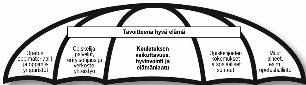
Kuvio 3. Luovissa tehtävien opinnäytetöiden aihealueet.

Intranettiin kootut opinnäytetyöt muodostavat opinnäytetyöpankin, jonka tavoitteena on tehdä tehty työ näkyväksi. Tämä koskee niin tehtyjä opinnäytetöitä kuin myös niiden tarkastelun