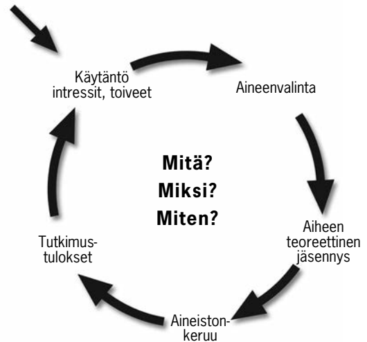
Kuvio 1. Tutkimuksen peruskysymykset ja tutkimusprosessi.

Työhöni tutkimuspäällikkönä sisältyy Luovissa tehtävien opinnäytetöiden koordinointi. Koordinointitehtävä kattaa koko tutkimusprosessin aiheenvalinnasta ja tutkimusluvun hakemisesta tutkimustulosten julkaisuun ja levittämiseen. Toimenkuvaani kuuluvat muun muassa tutkimuslupien myöntäminen ja opinnäytetöiden ohjaus. Opiskelijat saavat minulta ohjausta aiheenvalintaan, tutkimuslupien hakemiseen, tutkimuksen toteutukseen ja raportointiin sekä lähdevinkkejä tarpeen mukaan. Töille nimetään lisäksi tarvittaessa tutkittavaa aihe- ja tehtäväaluetta tunteva työelämäohjaaja. Ohjauksen perustana ovat tutkimuksen peruskysymykset mitä, miksi, miten ja tutkimusprosessin jäsennsy niiden avulla (kuvio 1).