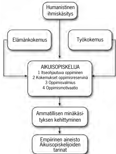
Kuvio 2. Tutkimuksen teoriakehys.