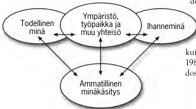
Kuvio 1. Ammatillinen minäkäsitys tässä tutkimuksessa.