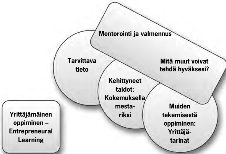
Kuvio 4. Oppimismahdollisuuksia yrittäjälle - Yrittäjämäinen oppiminen (Thompson 2006, 115).

Kuviossa 4 esitetyn Thompsonin (2006, 115) yrittäjämäisen oppimisen mallin mukaan yrittäjäksi ei opita luokahuoneissa tai valmennusohjelmien avulla vaan pikemminkin kokemuksellisen oppimisen kautta. Valmennusohjelmat ja yrittäjyysopinnot ovat hyödyllisiä, mutta ne eivät ole ainoa tapa oppia yrittäjyyttä. Yrittäjyyttä opitaan pääasiassa kokemuksellisen oppimisen menetelmin - työssä oppimalla – ja kuuntelemalla menestyneiden (tai epäonnisten) yrittäjien tarinoita. Luonnollisesti opiskelijoilla on oltava sen verran tietoja ja taitoja, että he osaavat hyödyntää ympärillään olevaa informaatiota ja tarinoita.