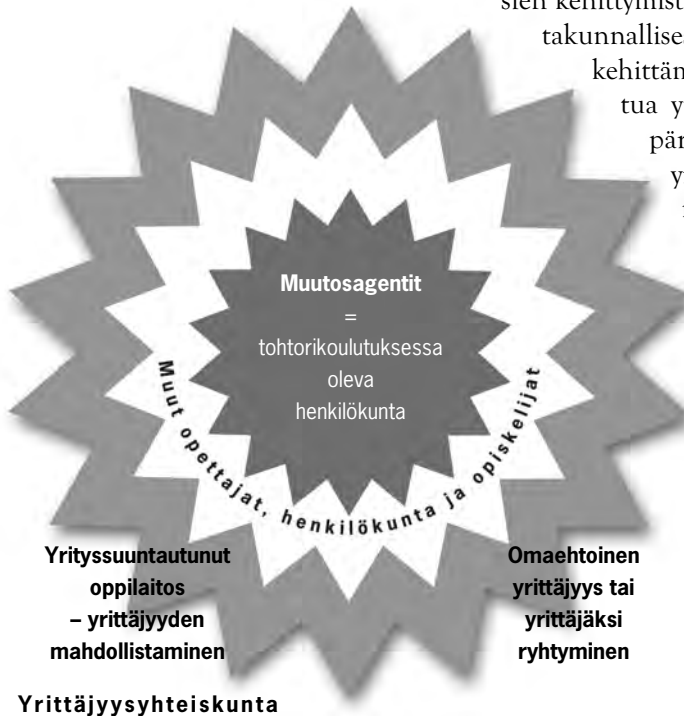
Kuvio 3. Yrittäjyyden säteilyttäminen oppilaitosorganisaatiossa

tähän projektiin liittyviin kehittämisprojekteihin ja kokeiluihin. Myös muilla opettajilla on mahdollisuus osallistua jatkokoulutuskursseille, yrittäjyysseminareihin ja erilaisiin yrittäjyyskasvatukseen liittyviin tilaisuuksiin. Voidaan puhua ns. ”säteilyvaikutuksesta”. Kuvion 3 mukaisesti koulutusprojektiin osallistuvat opettajat luovat ympärilleen yrittäjyyskulttuuria, joka säteilee koko oppilaitoksen toimintaan ja yrittäjyyden ”säteilyttäminen” kaikkeen opetukseen on siten helpompaa toteuttaa.