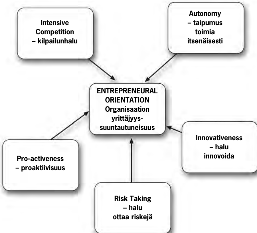
Kuvio 1: Yrittäjyysuuntautuneisuuden ulottuvuudet (Lumpkin & Dess, 1996).