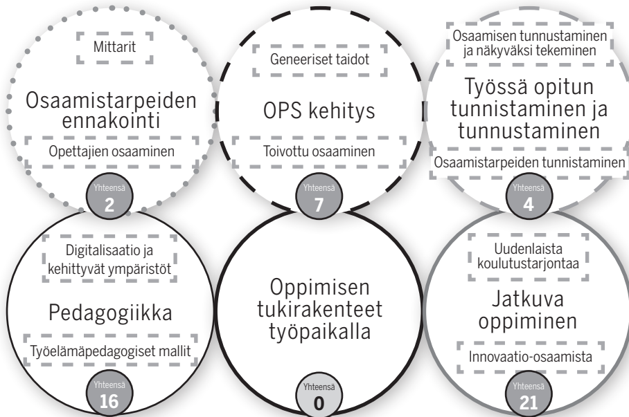
Kuva 1. Korkeakoulutuksen työelämärelevanssin kehittämisen keskeiset teemat (Brauer ja muut, 2020) opetushenkilöstön ja työelämäedustajien kokemana.

Alustava teemoittelu ja määrällinen havainnollistaminen kuvaavat, miten opiskelijat kokevat keskeisiksi työelämäyhteyden kehittymisen kannalta samat teemat kuin opetushenkilöstö ja työelämäedustajat, kuitenkin toisin painottaen. Opiskelijat korostivat erityisesti digitalisaation tuomia osaamistarpeita ja tulevaisuuden mahdollisuuksia erilaisten laitteiden ja mediasisältöjen hyödyntämisessä. Myös heidän toiveensa koulutustarjonnan kehittämiseen liittyi keskeisesti uusiin sisältöihin ja teknologioiden monimuotoiseen hyödyntämiseen, kuten videolukujärjestyksiin ja videopedagogiikan kehittämiseen. Teemoittelun tuloksissa on huomattava lukuisat huomiot liittyen geneeriseen