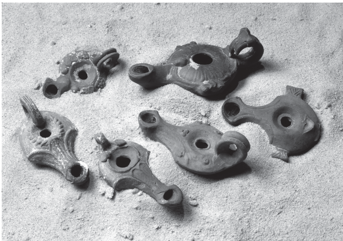
Bosporan mould-made lamps, from Kertch (Crimea), courtesy of Dr Denis Zhuravlev & State Historical Museum, Moscow. Photo © Vassili Mochugovsky

189. D. V. Zhuravlev, A. A. Zavoikin, "Svetilniki iz svyatilitchsha elevsinskikh bogin "Beregovoi 4"", in A.A.V.V., Bosporskiy fenomen: problemy khronologiy i datirovki pamyatnikov (Chast 1) , Sankt Peterburg 2004, 191–99.