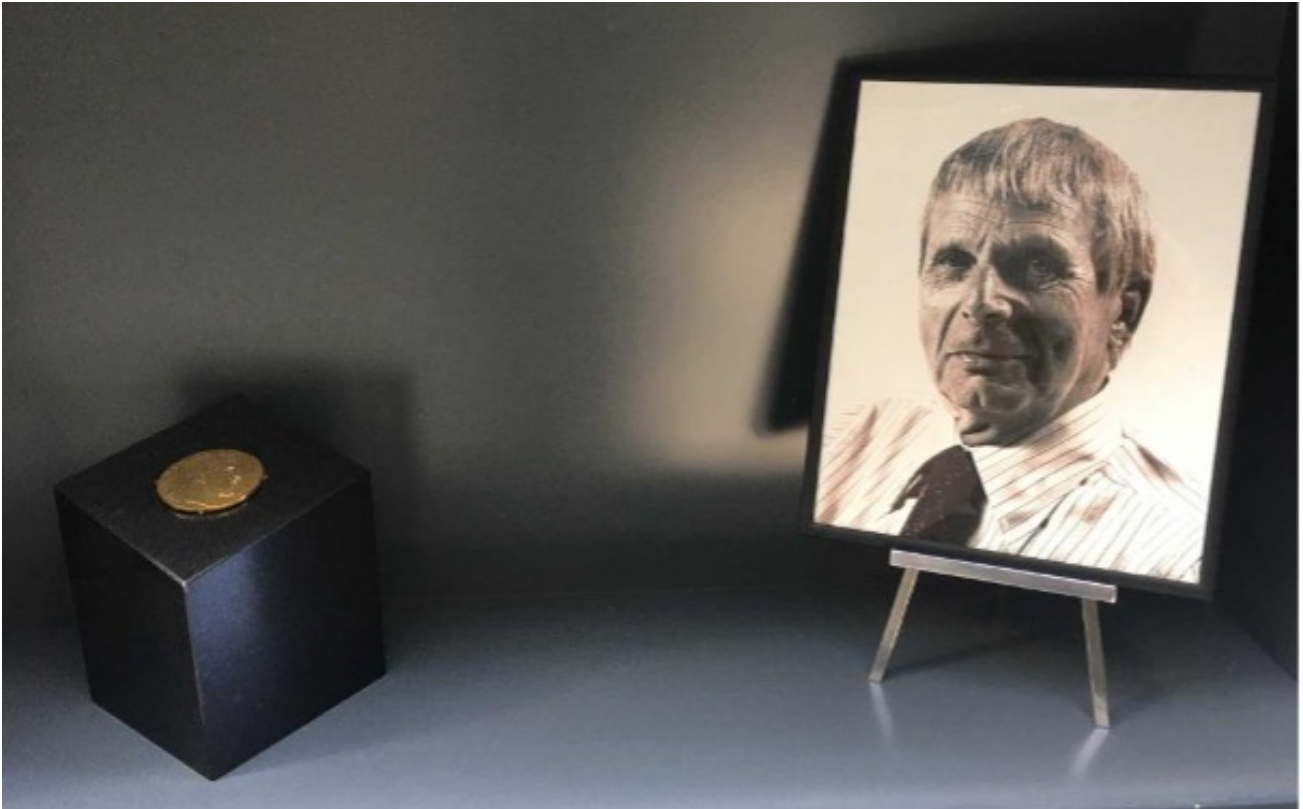
Lars Ahlforsin saaman Fieldsin mitalin kopio on vitriinissä Helsingin yliopiston Kumpulan kampuksella Lars Ahlfors -luentosalin oven vieressä.