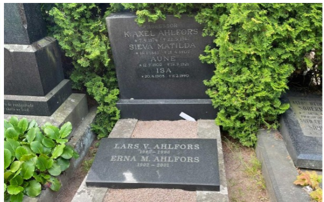
Ahlforsien sukhauta Hietanimen hautausmaalla Helsingissä. Haudan tarkka sijainti löytyy hautahaku-palvelusta.