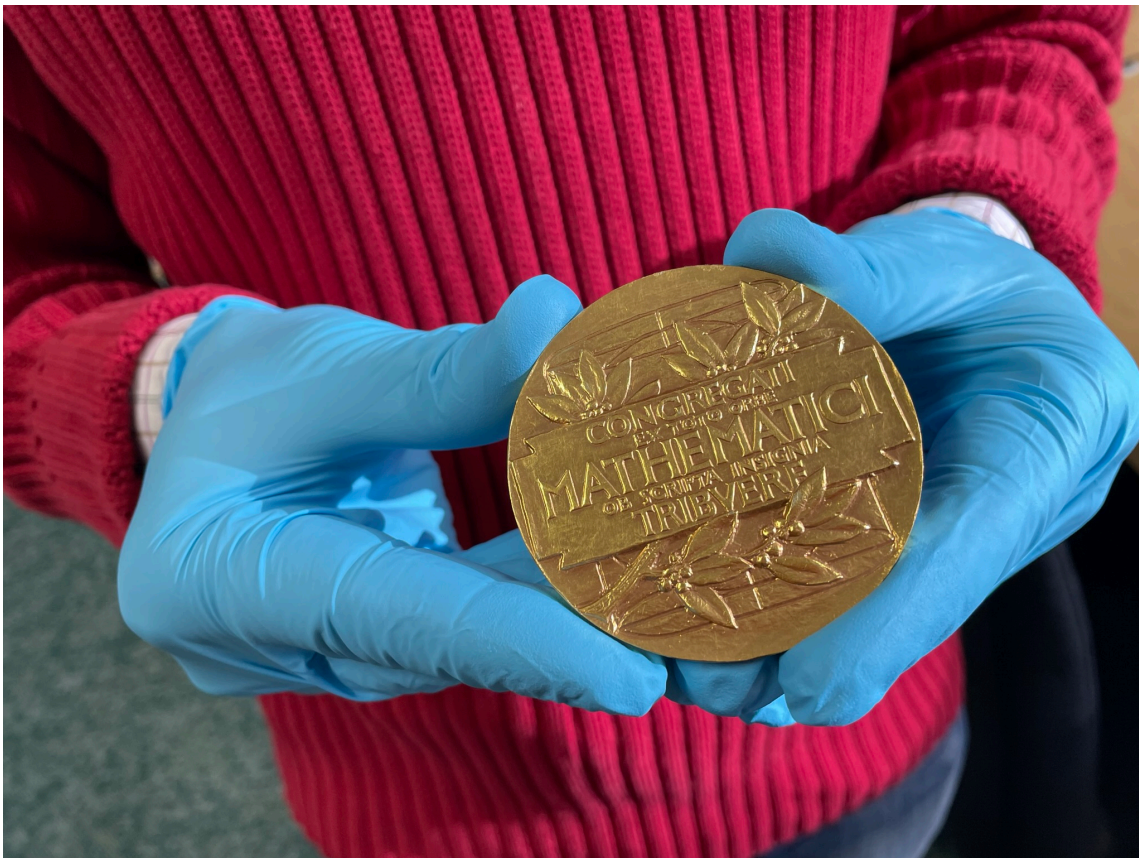
Fieldsin mitalia säilytetään Helsingin yliopistomuseo Liekin varastossa. Viimeksi se on ollut yleisön nähtävänä vuonna 2007 Ahlforsin 100-vuotissyntymäpäivän kunniaksi avatussa näyttelyssä, jonka nimi oli "Matematiikka – perinnettä ja sovelluksia".