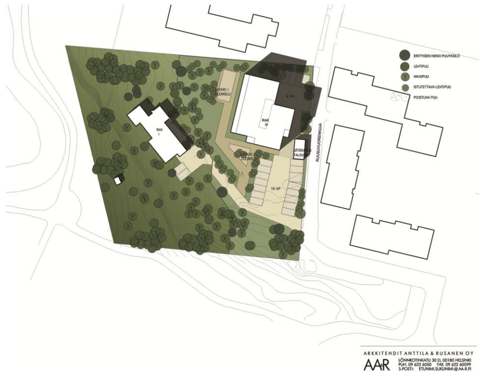
Kuva 4. Täydennysrakennettava hissillinen kerrostalo parantaa elämäntaajiasumisen mahdollisuuksia lähialueellaan.

Asemakaavasuunnittelija pohditti rakennusoikeuden määrittelyn huolellisesti, huolehti kaikkien asiantuntijoiden työn siirtymisessä asemakaavaan ja vastasi asemakaavan valmistamisesta verkostoon hyväksikäyttäen. Asemakaavasuunnittelija teki yhteistyötä myös Vantaan yrityspalvelujen kanssa sen laatiesa kaavaan liittyvän yhteistoiminta- ja laatusopimuksen (Koskivaara 2011), jonka myötä oli kiinnitettävissä ulkoisia resursseja tämän elämäntaajiasumista edistävän hankkeen toteuttamiseksi myös tilanteessa, jossa kaupungin omat resurssit ovat vähäiset (Pentimikko, 2011b).