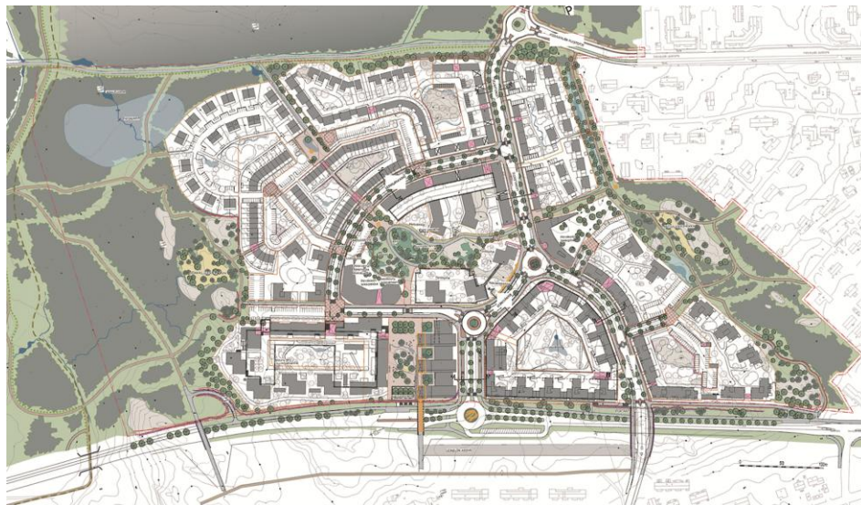
Kuva 3. Lähiympäristösuunnitelma toimii alueen toteutussuunnittelua ohjaavan laaturyhmän viitesuunnitelmana.