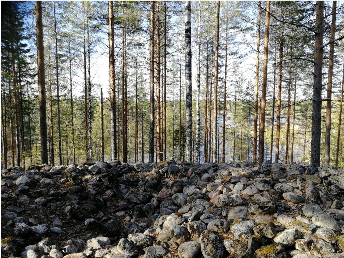
Kuva 1. Suurikokoisia ja maisemaa hallitsevia röykkiöitä harjun päällä Maaningan (Kuopion) Kesksisaarella.

käytettyjen kansankielisten nimien kanssa, esimerkkinä nimitys jättengrafvar . 4 Aiemmassa tutkimuksessa on osoitettu, että lapinraunio-termin käyttö alkaa jo 1700-luvulla. 5 Tämä on harvinaista suomalaisessa arkeologisessa terminologiassa, joka on pääsääntöisesti muodostunut vasta 1800-luvun loppupuolen ja 1900-luvun alun aikana. Röykkiöt ja muut kivrakenteet olivat käytännössä ainoita 1700-luvulla tunnettuja esihistoriallisia kiinteitä muinaisjäännöksiä tai sellaisiksi tunnistettuja, ja näin ollen niistä myös kirjoitettiin. 6 Tässä artikkelissa tarkastelen 1700–1800-lukujen lähdeaineiston kautta kysymyksiä lapinraunio-termin alkuperästä ja käsitteen kehityksestä: Kuka Suomessa keksi nimittää varhaismetallikautisia röykkiöitä lapinraunioiksi ? Kekisivätkö termin Henrik Gabriel Porthanin (1739–1804) kaltaiset historiantutkijat, jotka olivat kiinnostuneita suomalaisten ja saamelaiden välisestä historiallisesta suhteesta, vai poimivatko he sen käyttöönsä kansankielestä tukemaan omaa käsitystään Suomen alueen asutushistoriasta? Millaisista rajanvedoista suomalaisen identiteetin suhteen käsitteet kertovat, ja miten ne näyttäytyvät aikalaiskeskusteluissa kaukaisimman menneisyyden etnisyyksistä?