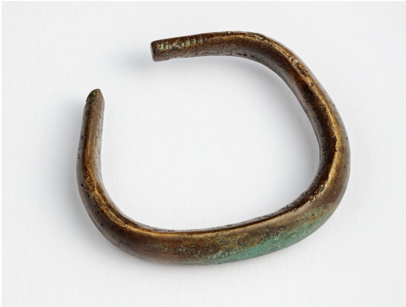
Kuva 3. Viitasaaren Rantala B -lapinrauniokohteelta löytynyt nuoremman roomalaisen rautakauden (200–400 jaa.) pronssinen rannerengas, joka tarinan mukaan aiheutti painajaisia sitä hallussaan pitäneelle kalastajalle. KM 8739:2, Museovirasto, arkeologian esinekokoelma. Kuva: Museovirasto/Finna.

Pohjolan vanhimmat asukkaat, leikkivät syvässä metsässään, missä puut ovat yhtä vanhoja kuin maailma ja niiden tuuheet oksat toisiinsa kietoutuneita ja missä pensaikoissa piileskelee mitä vilskeimpiä eläimiä.” Silti Gananderin oma näkemys tuntuu olevan, että vaikka kiviröykkiöitä pidetään jättiläisten tekeminä, niistä useimmat ovat ”lappalaisten köyhien majojen jäänteitä”. 54 Useissa 1700-luvun lähteissä ”lappalaisasutukseen” yhdistettiin kiviröykkiöiden lisäksi, tai niitä useammin, esimerkiksi puisten majojen jäännöksiä, kivikehää ( lappringar , lapinkehät ) tai metsissä näkyviä kuoppia, joiden ajateltiin olevan pyyntikuoppia tai asumusten pohjia. 55