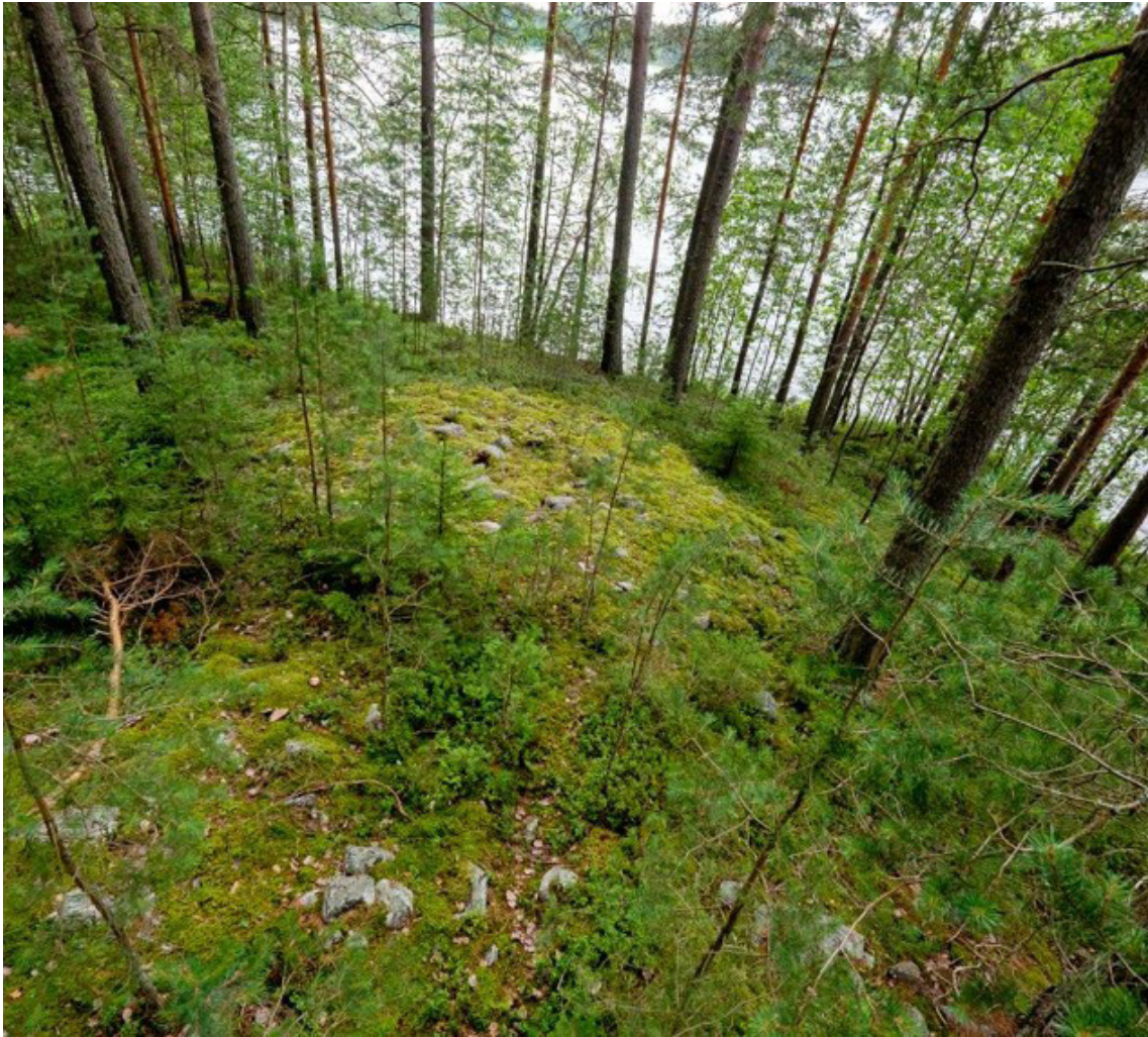
Kuva 2. Lapinraunioita Kuopion Kuusikkolahdenniemen muinaisjäännösalueella.

raunioiden tarkoituksen liittyvän maiseman hallintaan ja rajoihin: joko esimerkiksi yhteisöjen välisiin konkreettisiin rajoihin tai näkyvän ja näkymättömän maailman välisiin rajapintoihin. 32 Lapinraunioita rakennettiin tyypillisesti kallioille vesistöjen äärelle, joskus hyvinkin lähelle vesirajaa. Jarkko Saipio onkin esittänyt, että tämä eri elementtien kohtaaminen on ollut tärkeää lapinraunioita rakentaneille yhteisöille ja näiden monumenttien rakentaminen on ollut yhteydessä heidän kosmologisiin käsityksiinsä (Kuva 2). 33