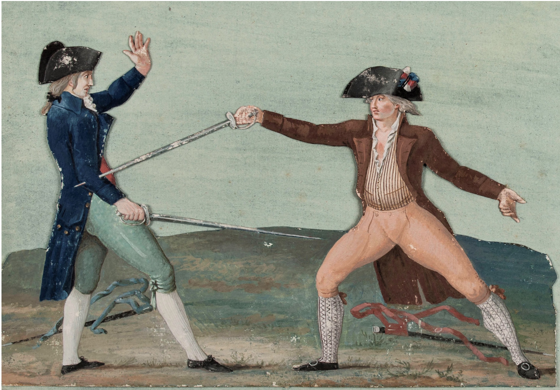
Kuva 4. Jean-Baptiste Lesueur (1749–1826), Duel de Charles Lameth et du marquis de Castries (1790) , guassipiirustus kaksintaistelevista miehistä, kuva Wikimedia Commons.

sen visuaalinen ilme, siluetti ja materiaaliset ihanteet muuttuivat selvästi ja näkyvästi aikakausien myötä.