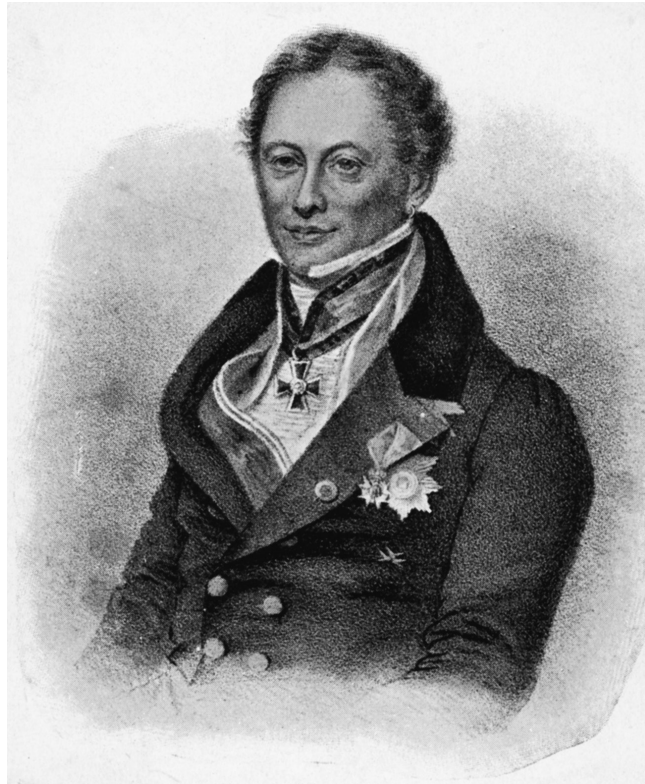
Kuva 1. Otto Wilhelm Klinckowström (1778–1850), tuntemattoman tekijän litografia.

tivat edelleen elinvoimaisilta. Myös sosiaalisen median toimintalogiikka näytti korostavan maineen merkitystä, etenkin poliittisten päättäjien ja valtiojohtajien henkilöbrändien rakentumisessa.