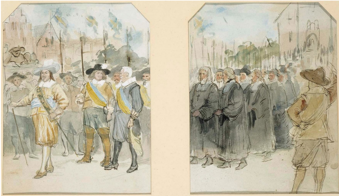
Kuva 1. Albert Edelfelt, Turun Akatemian vihkiäiset 1640, vaihtehtoinen seinämaalauksen kilpailuehdotus.