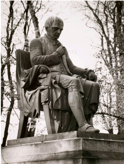
Kuva 7. C. E. Sjöstrandin Porthan-patsas.

peräisyyttä ja kansainvälistä merkittävyyttä, niin siihen liittyy erilaisia välineellisiä arvoja, jotka koskevat muun muassa heidän dissertaatioitaan, opetustaan ja ohjaustaan.