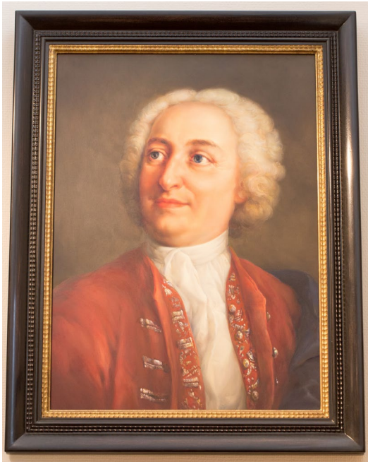
Kuva 2. Christoph Wetzel, Christian Wolff.

Wolffin näkemyksiin perustuva wolffilaisuus oli Turun akatemian filosofinen pääsuuntaus 1700-luvun puolivälissä ja loppupuolella, kunnes Kantin kriittiseen filosofiaan perustuva kantilaisuus syrjäytti sen. 42 Euroopassa suosiossa ollut empirismi ei sen sijaan saanut merkittävää kannatusta Turussa, joskin akatemiassa toimi empirismistä kiinnostuneita henkilöitä, kuten Hassel ja luonnontieteen professori Johan Browallius (1707–1755) 43 – Mesterton viittaa heihin kumpaankin disertaatiossaan, kuten huomaamme edempänä. Mesterton itse edustaa wolffilaista rationalismia, jossa rationalismi ja kokemus yhdistyvät. 44 Wolffilainen rationalismi ei täten ole niin sanottua voimakasta rationalismia , jossa kokemustieto hylätään tyystin. Porthan puolestaan edustaa erityisesti uushumanismia , jossa painotettiin ihmisen henkisten kykyjen kehittämistä. 45 Porthanin yhteys empirismiin on kiinnostava: Oittisen näkemyksen mukaan Porthan edustaa empirismistä, kun taas Pietarisen mukaan tämä ei pidä täysin paikkansa, sillä Porthan hyväksyi rationalistienkin näkemyksiä. Pietarinen tosin huomauttaa, että Porthan myös kritisoi saksalaisia rationalisteja, kuten Wolffia, mutta lähinnä heidän vaikeaselkoisten ajatustensa ja termiensä takia eikä niinkään heidän filosofisesta metodistaan johtuen. 46 Pietarisen selvityksen perusteella pidän todennäköisenä, että Porthan kannatti empirismistä vain osittain.