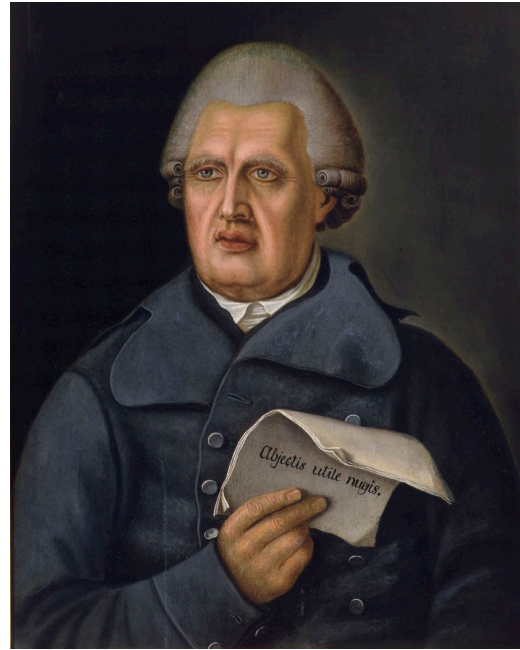
Kuva 5. Henrik Gabriel Porthan.