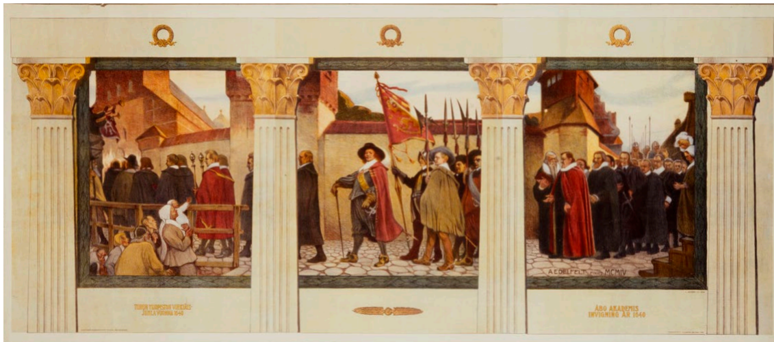
Kuva 6. Turun akatemian vihkiäisjuhla 1640, painokuva vuodelta 1908.