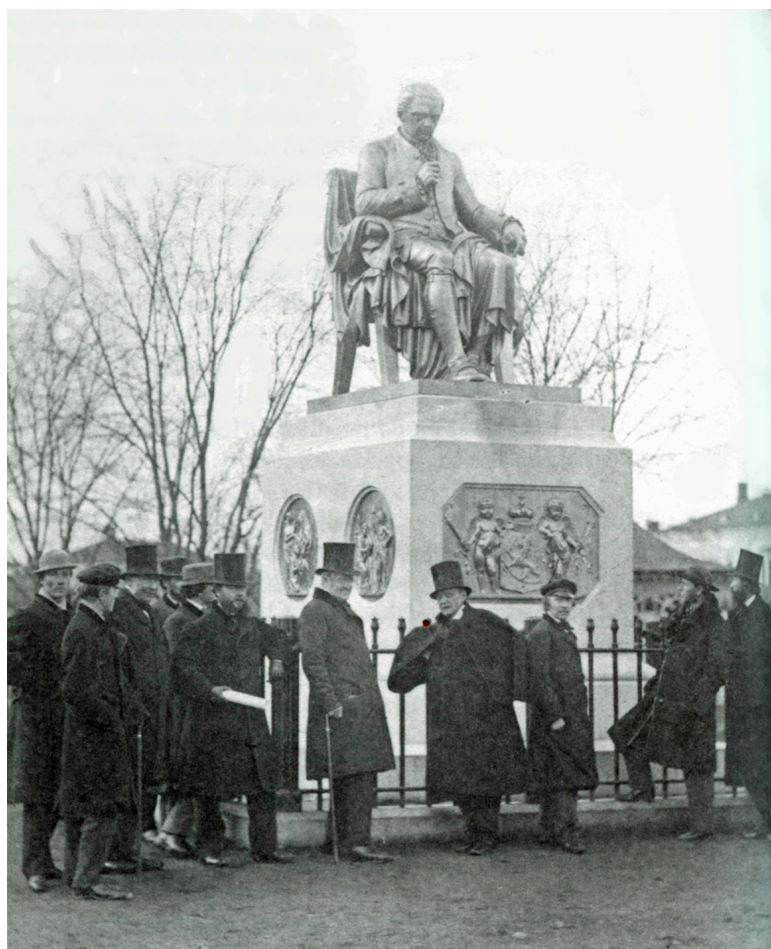
Kuva 2. Carl Eneas Sjöstrandin veistämän Henrik Gabriel Porthanin patsaan paljastustilaisuus 9. syyskuuta 1864.