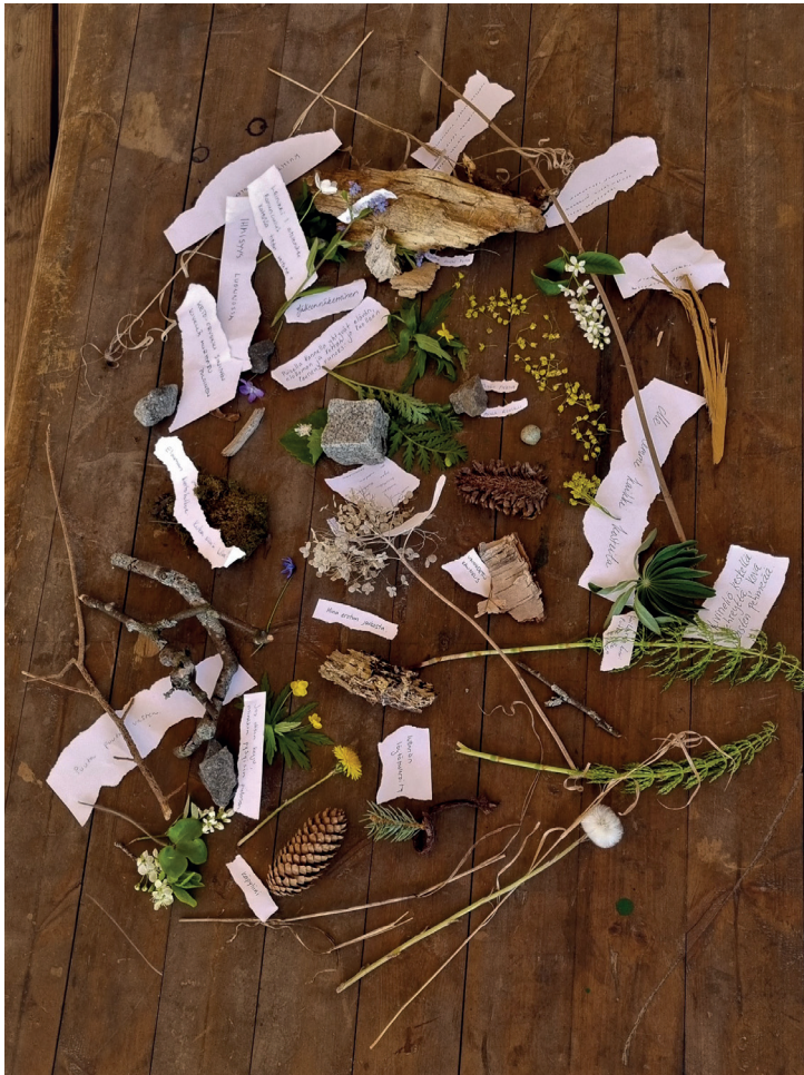
Kuva 1: Kollaasi. (Kaikki kuvat: Koistinen. Julkaistaan osallistujien luvalla.)

Kyselyvastauksissa mainittu materiaalisuus näkyy myös työpajateksteissä. Kollaasiharjoituksessa opiskelijoita ohjeistettiin keräämään ympäristöstä 1–2 luonnonmateriaalia sekä kirjoittamaan 1–2 lyhyttä tekstifragmenttia tai säettä. Nämä koottiin yhdessä kollaasiksi ulkona sijaitsevalle puupöydälle (kuva 1). Lopuksi muutama opiskelija luki kollaasin tekstit kaikille ääneen. Kollaasia koottiin ja tekstejä kuunneltiin syventyneessä ilmapiirissä. Eräs osallistuja (#7, K10) kertookin, että kollaasin tekeminen oli ”aivan meditatiivinen kokemus”. Tämä resonoi kyselyvastauksissa mainitun luonnon äärelle pysähtymisen kokemuksen kanssa.