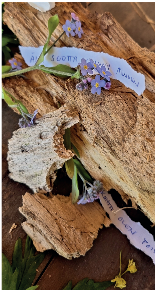
Kuva 3: ”Älä suotta kiinny minuun”. Osa kollaasia.

Toisessa kohtaa säkeet ”Älä suotta kiinny minuun / kohta olen poissa” (kuva 3) herättävät ajatuksia luonnon kiertokulusta ja ihmisestä osana sitä mutta myös kollaasiteoksen materiaalisesta hauraudesta ja hetkellisyydestä; puhuja voi olla ihminen, mutta aseteltuna luonnonmateriaalien lomaan säkeet tuntuvat antavan äänen ei-inhimilliselle. Näin kollaasi viittaa inhimillisen ja ei-inhimillisen yhteiseen haurauteen ja jaettuun temporaalisuuteen – mikään ei ole ikuista. Kollaasi jätettiin työpajan jälkeen pöydälle. Sen tekstit kenties tarttuivat tuuleen ja lensivät pois, kasvit lakastuivat, ja joku todennäköisesti lopulta korjasi työn pois.