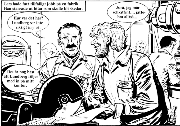
Bild 11. "En helt vanlig olycka" (1994). Notera ölflaskan i bakfickan!

stället alkoholister; ligister; eller unga som inte har fått ordning på och kontroll över sitt alkoholintag ännu.