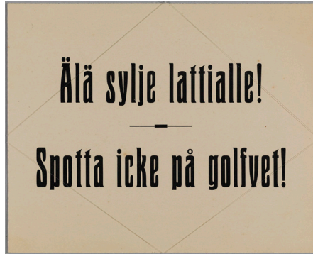
Mässingsskylt. Helsingfors stadsmuseum. 1900.

Myndigheterna blandade sig under denna tid i hemmens hygieniska förhållanden, något som uppfattades som både pinsamt och kränkande (Lähteenmäki 2004:201).