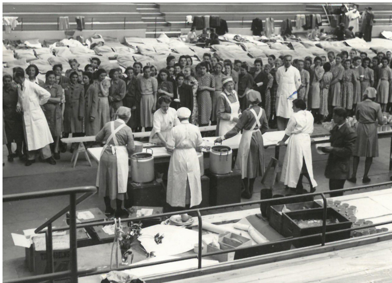
Utspisning av kvinnor från Ravensbrück i Gamla Tennishallen i Lund 1945 (KM 85653.)

Mat, moral och normalitet i svenska flyktingläger 1945