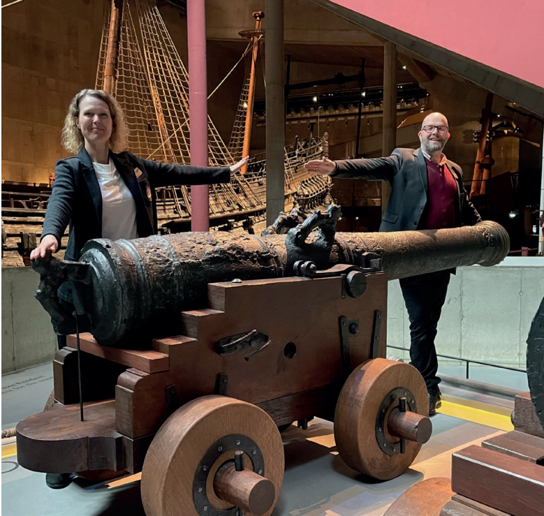
BILD 6: ”Onsdagen den 19 maj öppnar Vasamuseet för besökare igen – efter att ha varit stängt i 200 dagar. Besökarna är välkomna att komma nära skeppet Vasa och samtidigt hålla avstånd till varandra. En Vasakanonlängd är lagom”. Pressmeddelande från Vasamuseet.

Parallellt med att museet kurerar en utställning som på ett kraftfullt sätt understryker att vasakanonernas uppgift var att sprida död och förödelse kan man alltså på andra ställen i museibyggnaden, eller i den egna publika och mediala kommunikationen, omge kanonerna med helt andra associationer. Nu används den ikoniska vasakanonen istället för att på ett mer lekfullt sätt presentera museet och dess samlingar. Genom att ta bort döden ur föremålet blir det möjligt att omtolka kanonen till att bli något annat än ett vapen. I shopen presenteras kanonerna som lämpliga att skjuta egna saluter