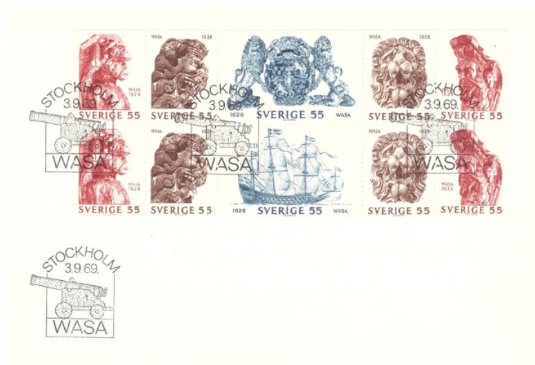
BILD 1: Vasas bronskanoner blev tidigt nära förknippade med skeppet. 1969 släpptes en serie frimärken som avbildade några av de bärgade statyerna. Stämpeln på förstadsbrevet gavs formen av en vasakanon.

Även om artikelns fokus ligger på Vasas kanoner – och mer exakt på deras senare öden från bärgningen och framåt – ska det nämnas att intresset för bärgade kanoner har en betydligt vidare spridning. Det kan illustreras av Kronanprojektet, den fortfarande pågående undersökningen av det sjunkna krigsskeppet Kronan som förliste utanför Ölands södra udde 1676. I samband med de arkeologiska utgrävningarna har det till dags dato tagits upp hela 47 bronskanoner från vrakplatsen. Man kunde tro att ett sådant antal skulle leda till en viss mättnad i den rådande kanonbevakningen. Men det mediala intresset tycks outtröttligt och efter en skyddande konservering får pjäserna en ny hemvist i Kalmar läns museums Kronanutställning.