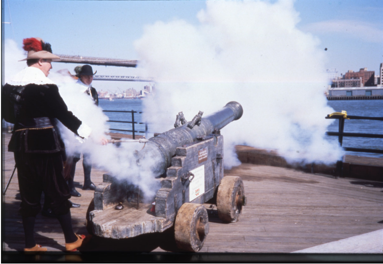
BILD 2: Kanonsalut i New York med anledning av 350-årsminnet av kolonin Nya Sverige 1988.

halvtimmeslångt inslag (med repris dagen därpå). För sändningen ansvarar Bengt Feldreich, en av dåtidens riktiga tungviktare. Återigen understryks den nära relation som uppstått mellan Vasa , museerna kring skeppet och olika slags mediala intressen. I sammanhanget ska även noteras att när ledningen för Vasamuseet år 2000 bestämmer sig för att upphöra med bruket att skjuta salut med originalkanonerna är det ett beslut som fullbordar de senares transition till endast museiföremål. 8 I det ögonblick som vasa-kanonernas tas ur aktiv tjänst som salutkanoner blir de slutgiltigt också bekräftade som omistliga delar av det nationella kulturarvet. Omvänt markerar ställningstagandet även ett visst avstånd från de mer offensiva och publika former av marknadsföring som präglade det gamla Wasavarvet.