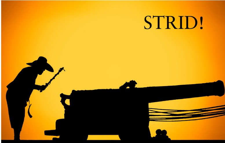
BILD 3. På logotypen till utställningen Strid! har kanonen getts en framträdande roll.