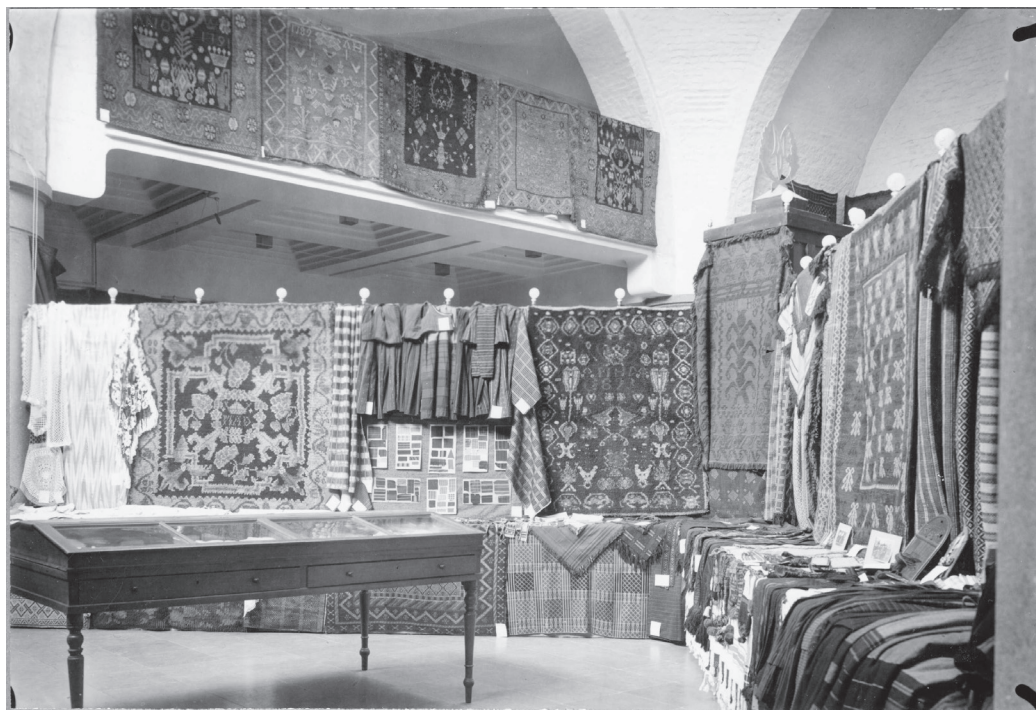
Textilutställning i Nationalmuseum i Helsingfors 1927. Svensk-Finlands textilarkiv.

kumentation, som sätter i materialet i ett konkret bruks- och tillverkningsssammanhang. Om Marthaförbundet ur ett mer vetenskapligt perspektiv kan man läsa framför allt i Anne Ollilas avhandling från 1993, Suomen kotien päivä valkenee... Marttajärjestö suomalaisessa yhteiskunnassa vuoteen 1939 (Ollila 1993). Avhandlingen behandlar förbundets samhällsroll och kvinnosyn, och även hemslöjden ur ett finlandssvenskt perspektiv får en biroll i boken. Vetenskapliga verk med ett specifikt intresse för just husmodersorganisationerna och deras hemslöjdsarbete har jag inte haft tillgång till vare sig gällande finlandssvenska, finska eller svenska sammanhang.