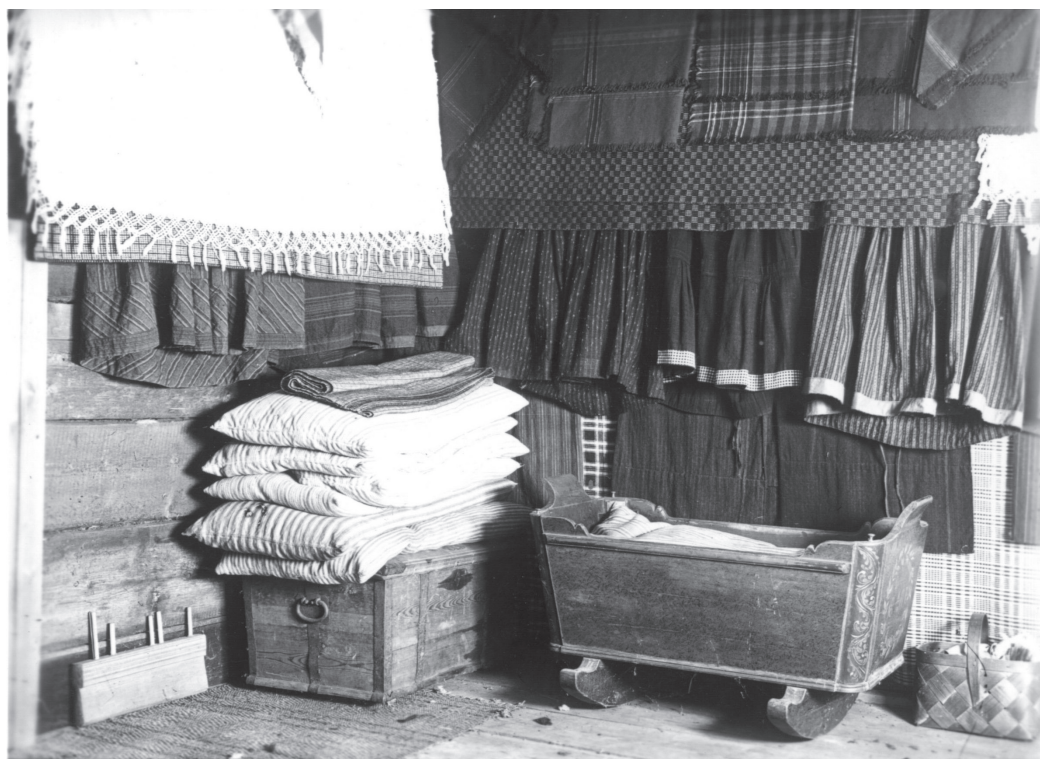
"Kläkamarin" uppe på vinden. Korsnäs 1930.

Den "rätta" hemslöjd Marthaförbundet ville arbeta för utfördes av en god husmoder som även vårdade sina textilier väl och tog vara på allt gammalt. Hennes intresse för och kärlek till textilarbete var en självklarhet. Hade hon inte redan (stora) textilkunskaper skulle hon i varje fall ha en önskan om att lära sig. Att låta något gå till spillo genom obetänksamhet kallades hushållssynder och när man skulle bygga upp en god karaktär gavs välgjord hemslöjd en stor betydelse. Detta hade också en koppling till traditionell textilsyn, där textilierna i ett (bonde)hem värderats högt och vårdats så att de höll länge och där textilarbete använts för att uppfostra och anpassa flickor till en lämp-