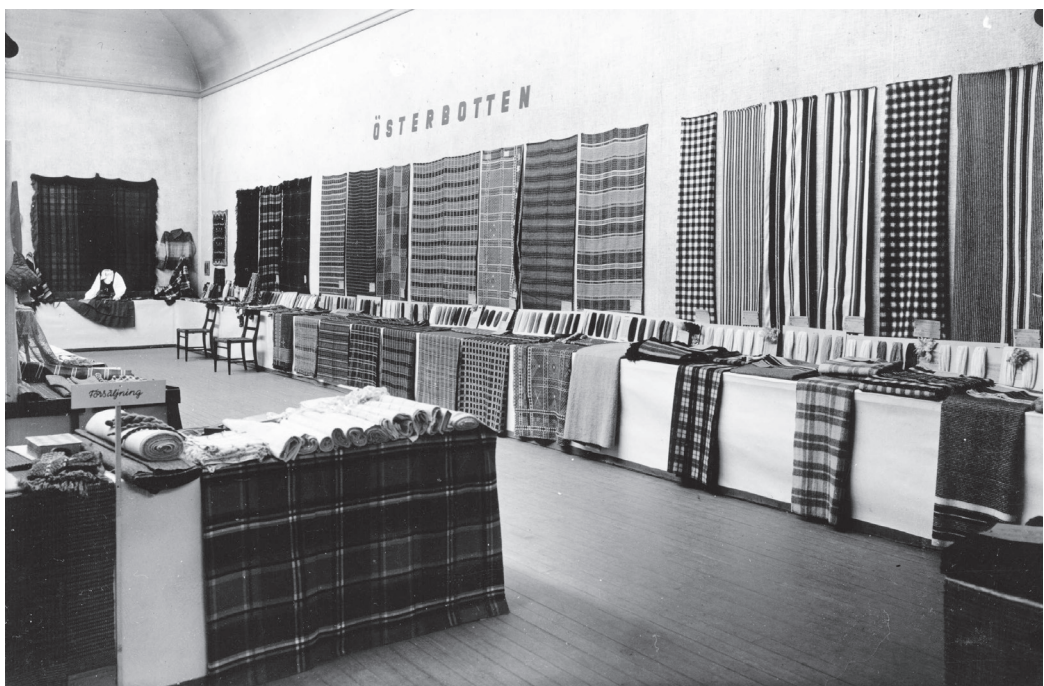
Gammal österbottensk hemslöjd på Finlands svenska Marthaförbunds utställning i Konsthallen i Helsingfors 1937.