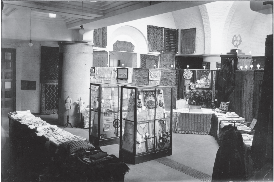
Textilutställning i Nationalmuseum i Helsingfors 1927. Svensk-Finlands textilarkiv.