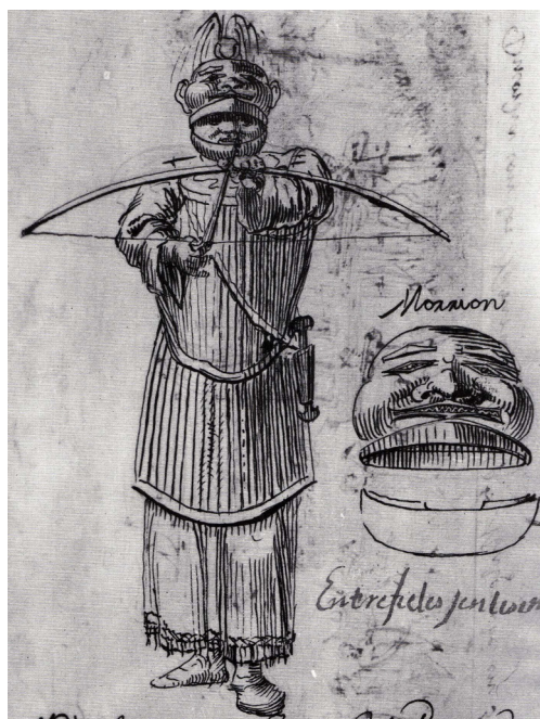
En fullt utrustad tlingitkrigare.

nat avslöja deras flykt och därför tagit livet av dem. Fortet återuppbyggdes och den nya bosättningen fick heta Novo Arkhangelsk, men kallades rätt allmänt för Sitka. De återkommande svårigheterna med tlingiterna fortsatte dock både i Sitka och annorstädes. Fort Yakutat förstördes till grunden av tlingiterna under ett blodigt anfall 1805 och återuppbyggdes aldrig. (Gibson 1980:175, Holmberg 1862:21-28, Pierce 1990:20-22, Furuhjelm 1932:66-7) 2 .