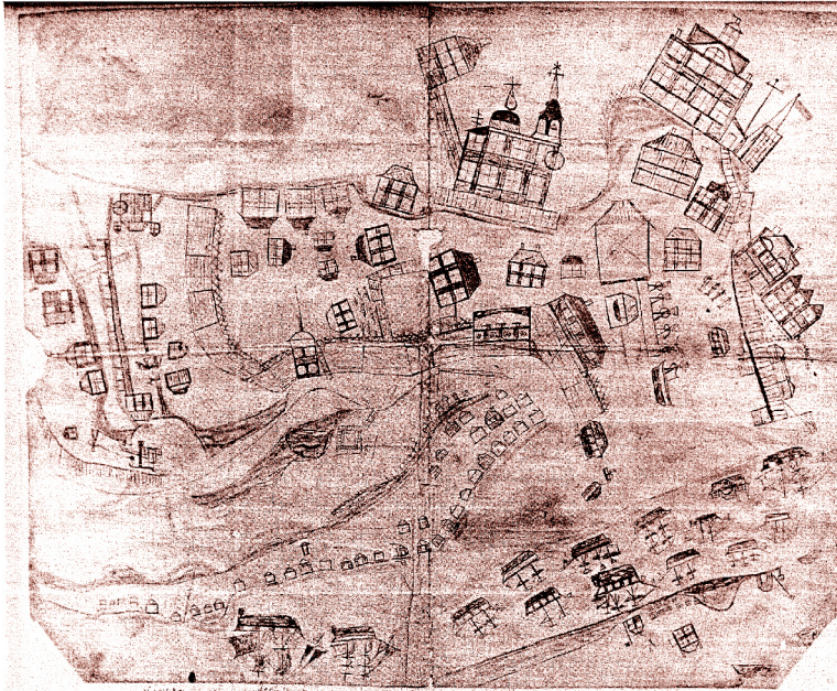
Sitka 1841 av okänd tlingitartist.

Ur målningar över staden framgår att åtminstone de större gatorna var täckta med plankor. I övrigt var vägarna och gångarna i staden leriga. I stadens östra hörn reste sig en kulle på vilken guvernören hade sitt residens. De flesta av stadens byggnader var mindre boningshus som påminde mera om kojor än om hus (Sahlberg 1995:70).