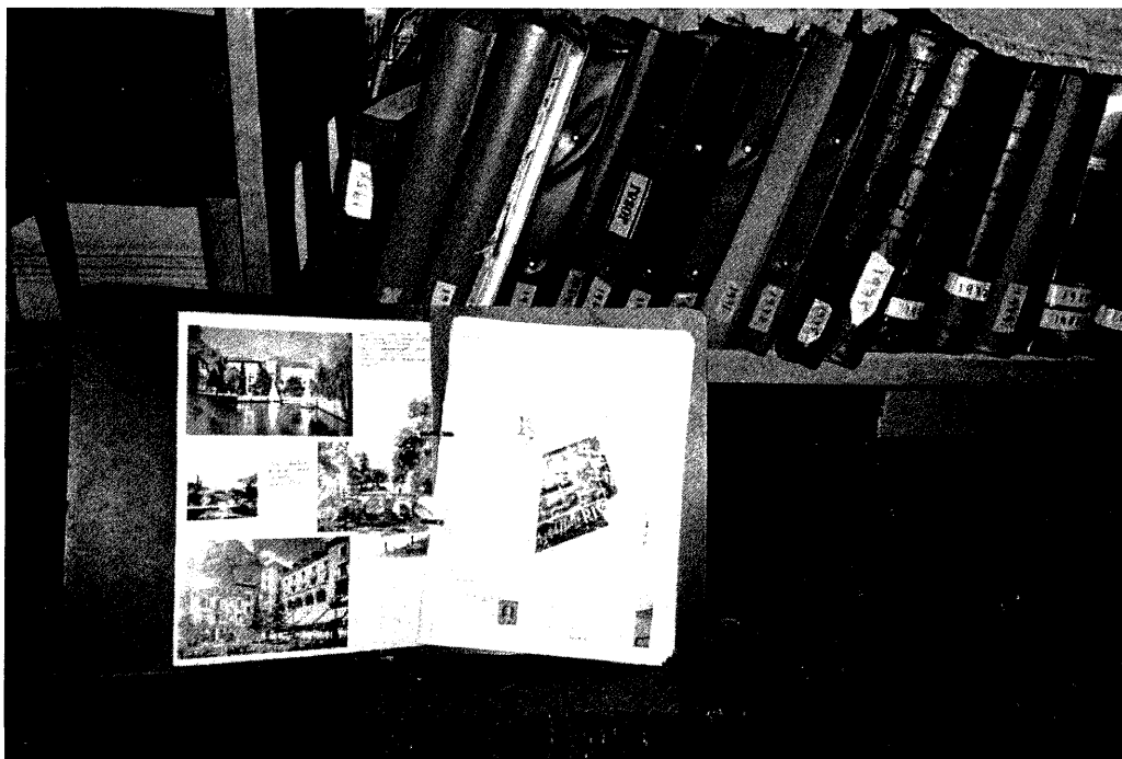
Under ett tidningsbord i Herrummet finner man ett trettiotal album med material och minnen från varje resa.

förändring och kausalitet - d.v.s. regelverket som innebär fastställandet av likhet, benämningar, inflytanden, orsaker och resultat. Avslöjandet sker också så snart vi överger tron på sådana "vetandets figurer" och raster som harmoni, imitation, likformighet och sympatisk förståelse. En ny fråga blir då i vilken form herrgårdskulturen har iscensatt sin begränsande olikhet och därmed sin självdefinierande och självidentifierande representation. På detta sätt kunde arrangemanget av tingen framstå som en "annan inredning" med ett eget "nätverk" av relationer, egna kategorier, begrepp, frågor och även - tystnader. Inventeringens nya uppgift blev att studera och försöka se på vilket sätt denna "andra konfiguration" radikalt skiljer sig från den vetenskapliga i klassisk mening. Det gällde att registrera även spåren av detta "andra subjekt", inte enbart iakttagbara objekt. Problemet växte. Blicken riktades på olika sätt att tala om tingen och sättet på vilket detta tal är arrangerat, vi kunde kalla det "Kulladamernas disposition att strukturera sin tingliga värld", där vi ändå endast indirekt har tillgång till det verbala språket. I denna kontext är alla ting i början likvärdiga. Kulturens - i detta fall herrgårdskul-