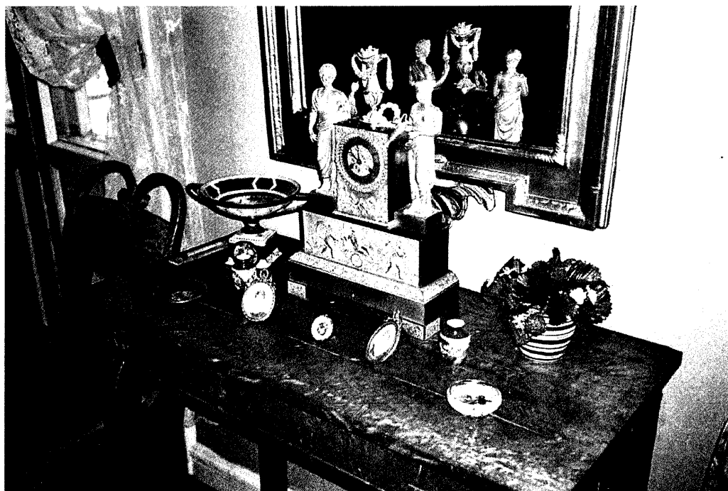
Spegelkonsolbordet i Salongen; ärvda ting, reseminnen, plastblommor.

Sedan 1500-talet har det europeiska vetandet baserats på en varseblivning av och insikt om ett "andra", vilket även präglat tingens ordning och format ett epistem av identiteter, differenser, karaktärer, ekvivalenser och ord. I det komplicerade fält av matematisk och fysikalisk ordning (ett deduktivt och lineärt länkande av evidenta och verifierade propositioner/scheman), språkets sätt att skapa kausala relationer och strukturell konstans (av diskontinuala men analoga element) ävensom den filosofiska