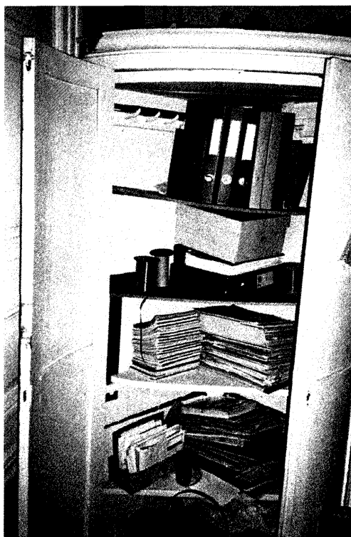
I runda hörnskåpet i förra Barnkammaren förvaras resdagböckerna från 1950-talet till 1990-talet, ca 25 journaler skrivna i ringpärmar.

Med vilken rätt skulle inventeringens makt, som baserades på förnuftet, bestämma över denna "andra värld"? Var gick gränsen för ett omordnande enligt "rationell" klassificering och museala kategorier?