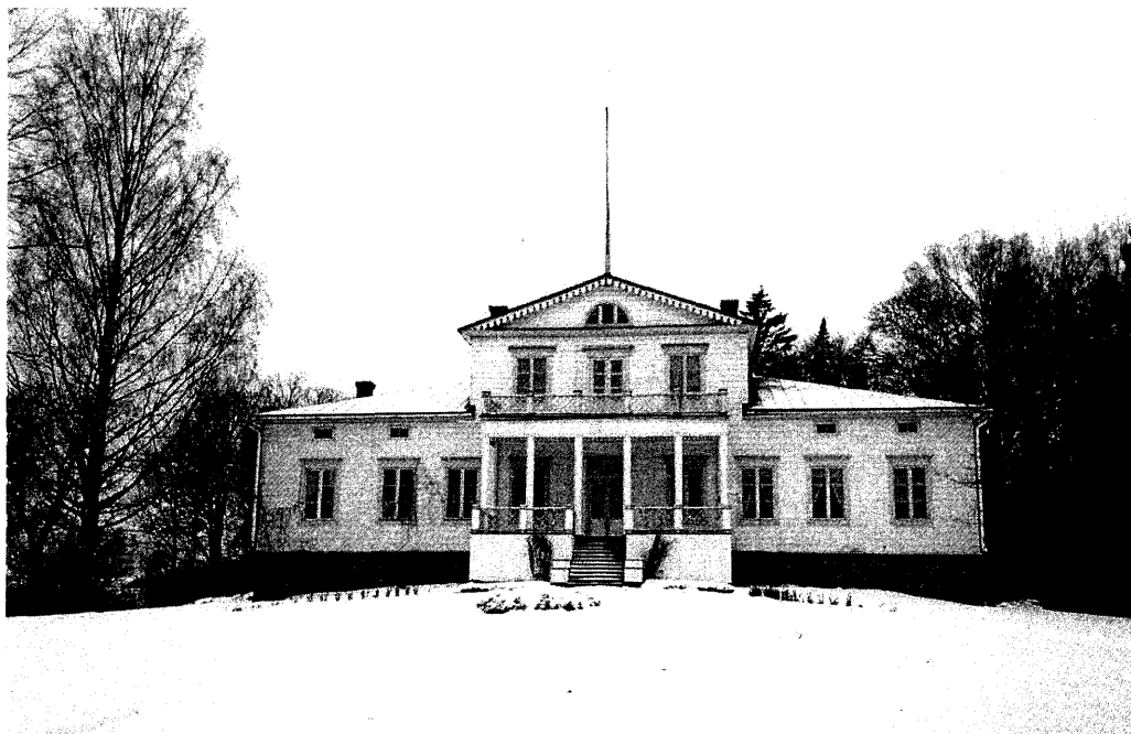
Kulla gård i Strömfors.

Det var följaktligen enligt idén om fredning 1987, som väckte positiv lokal respons, som fru Wallen i sitt testamente bestämt att Kulla herrgård skulle bli en stiftelse, vilket godkändes av Patent- och registerstyrelsen 2006. Uppgiften skulle vara: att bevara Kulla dels som ett levande lantbruk, dels som en natur- och kulturhistorisk miljö. Om ekonomisk möjlighet fanns skulle stiftelsen även stöda den svenskspråkiga lokala kulturen, främst det svenska daghemmet och