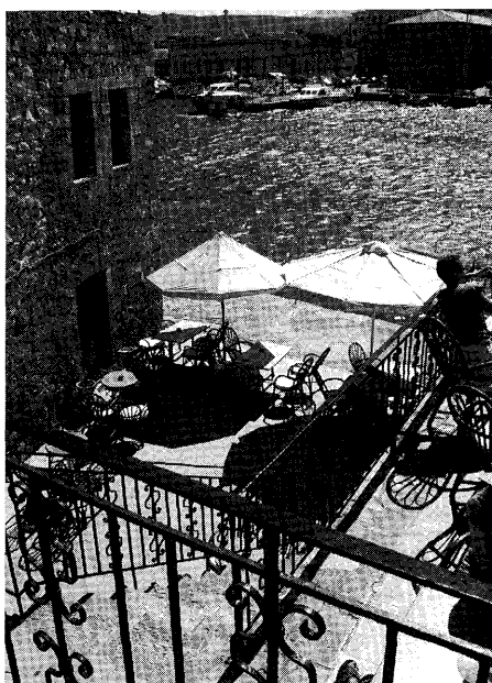
Bild 2. Att sitta på café eller restaurang och inmundiga lokala rätter, eller bara njuta av atmosfären och iakta folkvimlet på den främmande platsen hör utrikesresan till. Detta café ligger vid Haniyas venetianska hamn.

Turismindustrin, förekomsten av allt mer varierande turistprodukter och det över-