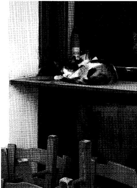
Bild 5. Kreta är även känt för sina katter som är i hög grad beroende av turisternas generositet. Foto: Pia Lindholm, 2008.

Artikelförfattarna konstaterar bl.a. att resandet har blivit en bestående del av de stora åldersgruppernas livsstil (Ahtola, Honkanen & Mustonen 2004:285). De efterkommande generationerna är etablerade i detta värdesystem och för dem är resandet en naturlig del av livet. Om den stora åldersklassens medlemmar och de senare generationerna fortsätter resa i den mån de gör idag kommer andelen äldre resenärer att öka märkbart. Ökningen syns också i