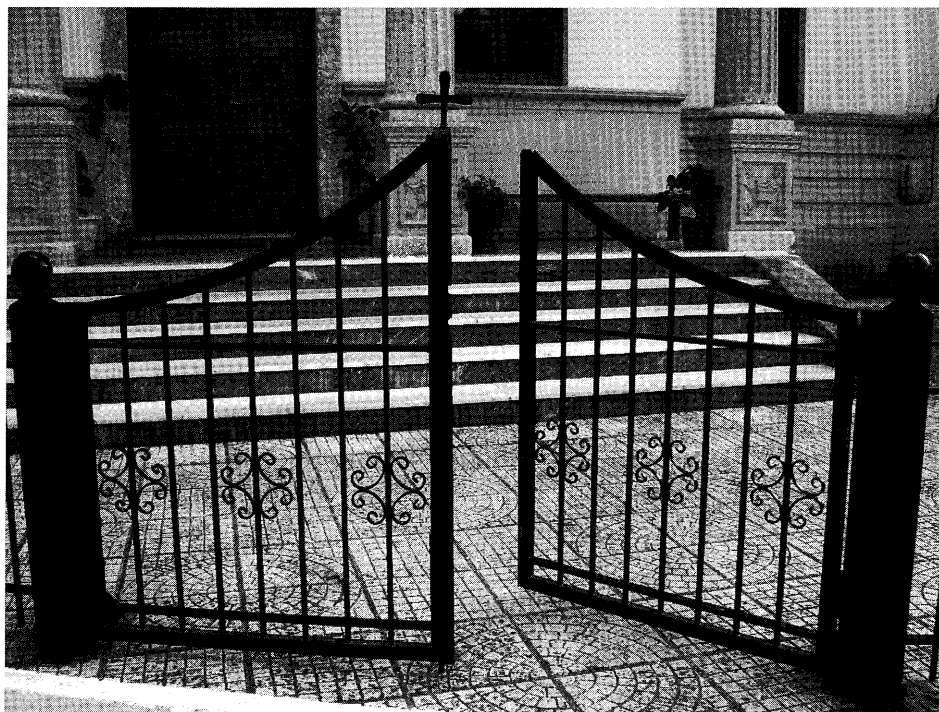
Bild 3. Porten till den vackra bysantinska kyrkan i byn Meskla på Kreta. Kyrkobyggnaden är ofta ett obligatoriskt besöksmål för olika typer av resenärer. Foto: Pia Lindholm, 2008.

Flera perioder och situationer i de äldre resenärens livscykel har alltså påverkat