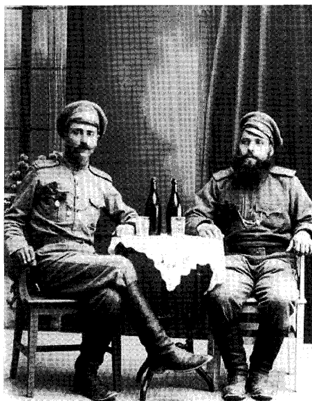
Bild 1: Första sittningen i brädskjulet 1.5.1910. Fotograf: Erik Hägglund 1910. Erik Hägglunds fotosamling, Vörå. ÖTA 135.

Under många år anlätades han även att texta kransband till begravningar och andra uppvaktningar. Att han var en erkänd målare även utanför den ordinära kundkretsen framgår av att han fick i uppdrag att dekorera Vörå kyrkas dörr och klockstapel med textade deviser, de första som möter besökare på väg in i kyrkan. Han restaurerade även möbler och tillverkade empirespeglar enligt äldre förlagor, något som har levt vidare genom andra hantverkare i bygden.