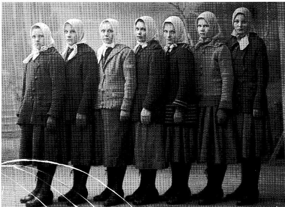
Bild 5: Skolflickor i Vörå, årsmodell 1927.