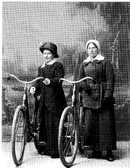
Bild 6: "Nyförvären visas upp och kragarna är på plats".