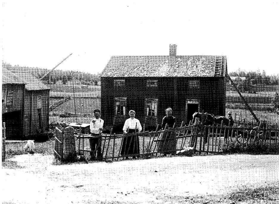
Bild 3: "Jag kan ju passa på och ta en bild, när jag nu råkar cykla förbi". Fotograf: Erik Häggglund 1921. Erik Häggglunds fotosamling, Vörå. ÖTA 135.

skeby. På baksidan av det första positivet finns nedtecknad information om personernas namn, språk, yrke och arbetsplats samt uppgifter om prissättningen. Ett provkort kostade 2 mark och efterbeställningar 50 penni styck. Uppgifter om kundernas språk återkommer inte på senare tagna fotografier. Möjligen ansåg Erik det vara anmärkningsvärt att de första kunderna talade ett språk han inte själv använde till vardags. Andra som lät sig avporträtteras i ateljén bland de allra första, var en grupp spelmän, ett förlovningspar, en bankdirektörsfamilj, fotografens hustru Anna, två emigrantpar, en grupp bondsöner och tre lekande småpojkar. Alla dessa var hemma från Rökiö eller grannbyarna. Bland de första bilderna finns också ett skolfoto från Koskeby folkskola. Skoleleverna i grannbyn är uppställda utanför skolhuset och har således fått besök av fotografen. Från år 1911 finns även vöråapotekarens gård dokumenterad, en stor byggnad som är fotograferad från landsvägen någon gång under den varma årstiden. De personer som är fotograferade