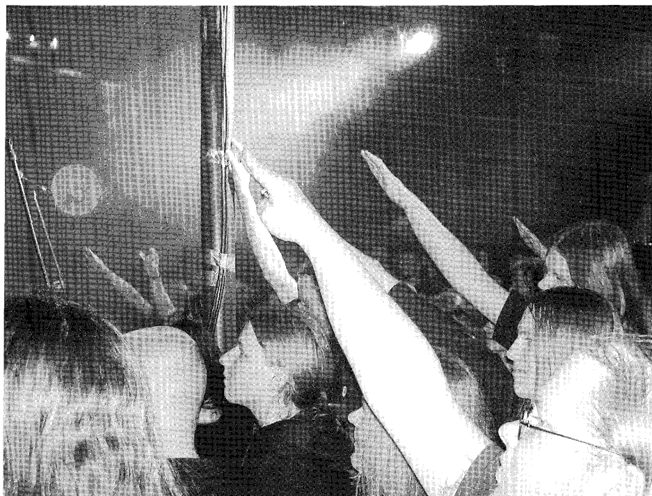
Bild 5: Kulturrasism. Publiken hyllar gruppen Satanic Warmaster genom att göra hitlerhälsningen.

sin egen roll enligt den meny som serveras från scenen.