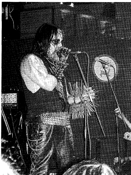
Bild 1: Nitars läder och corpsepaint. Blackmetalartist i full mundering.

I slutet av artikeln diskuterar jag kort deltagande observation som insamlingsmetod, och tar upp dess fördelar samt några intressanta dilemman som metoden har gett upphov till. Något som jag tycker att är intressant är forskarens roll i händelseförloppet, det vill säga hur mycket forskarens närvaro i en specifik situation kan tänkas påverka informanterna. Jag visar genom ett exempel ur mitt eget fältarbete hur jag genom min roll som forskare med kameran i högsta hugg fick en del av fansen på en konsert att iscensätta ytterligare en egen roll, fotografiobjektets roll. I detta fall var det alltså, i varje fall delvis, jag och min kamera som fick en del av publiken att med överdriven iver iklä sig rollen som blackmetalfans. Eftersom kameran utgör ett viktigt verktyg för mig då jag befinner mig i fält, har jag för att förtydliga min beskrivning av blackmetalkonsertens gång samt publikens och artisternas växelverkan, bifogat fotografier i denna text.