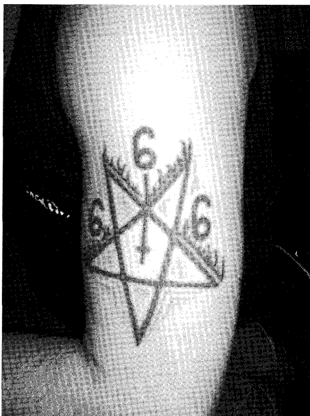
Bild 4: Bruket av sataniska symboler för att stärka den gemensamma identiteten är allmänt förekommande inom blackmetal. Här ett motiv som innehåller ett pentagram, ett upp-och-nedvänt kors och djävulens tal, det vill säga tre sexor.