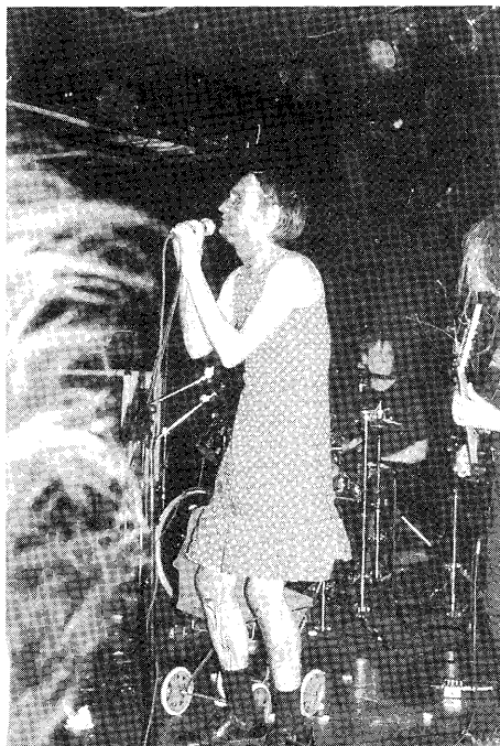
Bild 7: Genom att överträda gränserna mellan det manliga och det kvinnliga vill vissa artister häda mot kristendomen och chockera sin publik. Bilden är tagen under en konsert där den inhemska gruppen Black Dawn uppträdde i Åbo 28.05.2003.