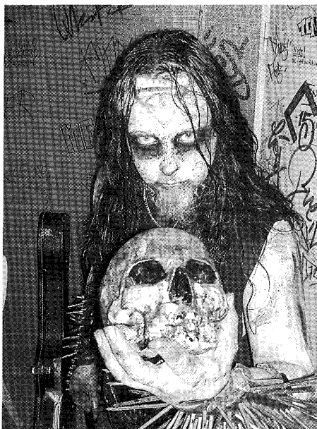
Bild 3: Sångaren i Behexen med sin blodbägare. Notera de grova spikarna i sångarens armband.

Denna serie av händelser väckte både hurrarop och buanden i publiken. Hurraropen kan tänkas bero på att kristendomen, som inom blackmetal representerar den övergripande västerländska kulturen, inte godkänner avvikande sexualitet varför transvestitisk blackmetal skulle vara ett sätt att häda kristendomen. Att häda kristendomen är ett populärt tema inom blackmetalkulturen, det är egentligen det antikristna elementet som utgör hela stommen för blackmetal (IF mgt 2001/75). Buandet