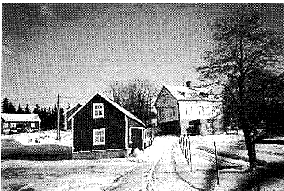
På bilden ses från vänster till höger ladugård, bod/vedlider, bastu/smedja/snickeri och huvudbyggnad.

Sonen minns att han som mindre gärna hjälpte till att bära in ved, eller så hängde han med när någonting skulle göras. Han minns inte att han skulle ha haft några speciella uppgifter, utan hjälpte till när det behövdes. För sonen var "moffa" en viktig person, som han ofta följde i helarna när någonting skulle grejas. Han minns många gånger som de varit tillsammans och hämtat gäddsaxar, eller snickrat i snickeriet. Någon gång var han kanske också med i smedjan eller upp i skogen. Genom minnena av "moffa" kan sonen kanske känna den närhet och intimitet, som vårt moderna samhälle har brist på. Som äldre har sonen deltagit aktivt i samma arbeten som de andra vuxna. Då har det varit frågan om följande sysslor: