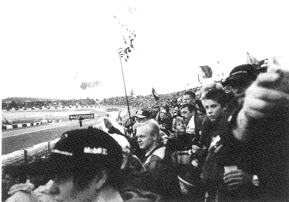
Formel 1-tävling på Nürburgring i Tyskland. Folkfest och en mångfald av flaggor.

Selberg menar att nyheterna egentligen är nytugåvor av kända varianter (Selberg 1995, 274).