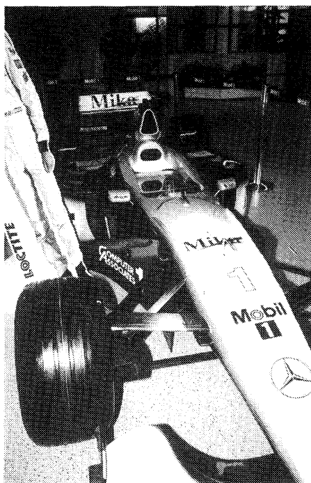
Formel 1 bilarna utvecklas ständigt och in i minsta detalj, för att bli snabbare, men också säkrare. Kan de ännu kallas "bilar"?

De två stora stallen med sina respektive frontfigurer, som i dagens läge lite för-