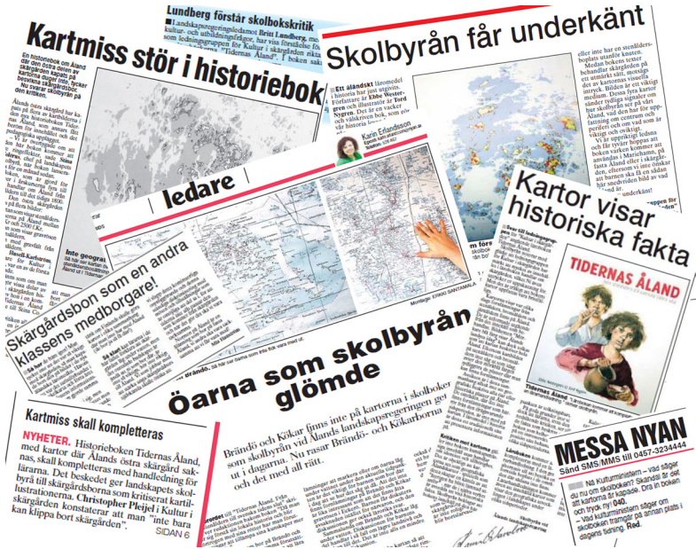
Ett kollage av tidningsmaterial som behandlar Tidernas Åland .