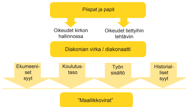
KUVIO 2. Diakonian virka ja kaksoissulkemisen strategia

Mikään esitetystä argumenteista diakonaatin rakentamiseksi ei vakuuta kaikkia varauksettomasti. Koulutuksellinen rajausta jättää vastaavan koulutustason omaavia ammatteja ulkopuolelle, eri ammattien hengellinen luonne jakaa mielipiteitä, esitetyn mallin ei sanota vastaavan kansainvälisiä malleja eivätkä historialliset argumentitkaan ole kiistattomia. Näyttääkin siltä, että komitea yhdistää erilaisia argumentteja etsiessään perusteluja sellaiselle diakonaatille, jonka se sai tehtäväkseen koota yhteen. Kirkolliskokouksen perustevaliokunta antoi komitealle tehtäväksi ”koota nykyiset diakonian, musiikin ja kasvatuksen virat yhteen” 49 . Päätökset siitä, keitä diakonaattiin lopulta kuuluu, ovat edelleen kesken.