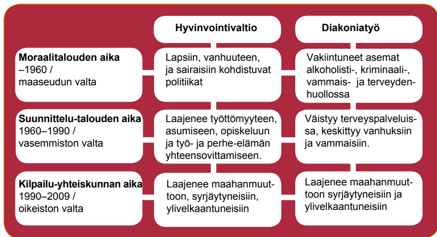
KUVIO 1. Hyvinvointivaltion ja diakonian välinen työnjako 1900–2010

tulopoliittisessa ratkaisussa eli Liinamaa I-sopimuksessa (1968) tätä velvollisuutta uudistettiin niin, että työnantaja pystyi korvaamaan tämän ”isännälle” kohdennetusti kuuluvan elatusvelvollisuuden kunnalle maksettuna huoltoapuna. Tämän ohella monilla työnantajilla oli pitkään 1960-luvulle merkittävää sosiaali- ja asuntopoliittista toimintaa. (Saari 1996.) Muita vastaavia järjestelmiä ovat olleet muiden muassa työnantajien tarjoamat päivähoito- ja asumispalvelut sekä perheturvan korotuksia 1960-luvulla korvannut kouluruokailun kehittäminen.