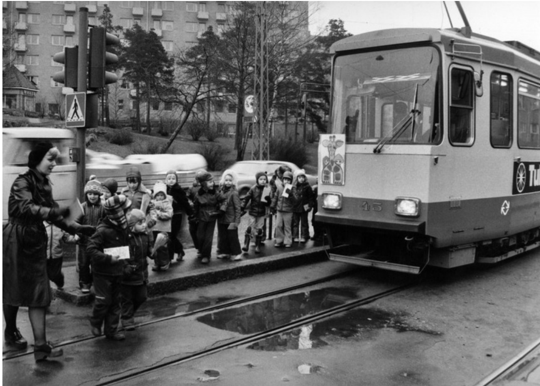
Kuva 2. Raitiotiepyysäkki Helsingin Meilahdessa. Kuusitien asukkaiden yhteydet keskikaupungille ja merenrantaan ovat olleet taannoisen Viipurin tapaan liikenteellisesti mainiot, onhan kotikadulle päässyt sekä busseilla että raitiovaunuilla. Kuvassa päiväkotilapsia 1975.

lastenrattaita kylpyhuoneessa, väliin ihmetellyn kosteudesta turvonneita ovia ( Helsingin Sanomat 1.12.1995, B 2).