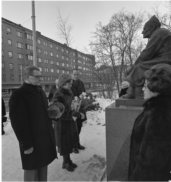
Kuva 1. Runonlaulaja Larin Parasken muistomerkki. Rautu-Seuran lähetystö kunniaikäynnillä 1974 Larin Parasken muistopatsaalla Hakasalmen puistossa Helsingissä.

runonlaulajista (esim. Suomen Sosialidemokraatti 3.1.1954, 7). Lisäksi hänet on usein asetettu karjalaisia runonlaulajia, erityisesti naispuolisia, symboloivaksi henkilöksi (esim. Helsingin Sanomat 21.4.1981, 23). Karjalaisuuden ohella Paraske on nähty aikaan ja paikkaan sidonnaisten paikallisten, alueellisten tai kansallisten motiivien mukaan ainakin suomalaisena (esim. ET 2/1999, 96–97, 99, 101) – kuten näköispatsaan jalustaan kai-verretussa tekstissä –, sekä suomalais-karjalaisena (esim. Nuori Karjala 3/2004, 64–65), kannakselaisena (esim. Suomen Kuvalehti 23.2.1935, 339), Metsäpirtin, Raudun ja Sakolan tyttärenä (esim. Rautulaisten lehti lokakuu 1983, 3) ja venäläisten ja priozerskilaisien maanmiehenä (ks. Nuori Karjala 3/2004, 64–65). Lisäkerrostuman on tuonut se, että häntä on pidetty inkeriläisenä (esim. Karjala 8.4.2004, 5), inkerinsuomalaisena (esim. Inkeriläisten viesti 14.4.1961, 14) ja inkeriläis-kannakselaisena (esim. Etelä-Suomen