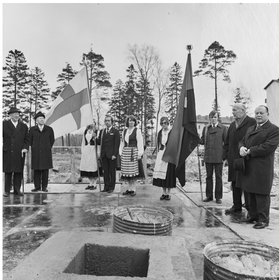
Kuva 4. Helsingin Käpylään nouseva Karjalatalo. Karjalatalon peruskiven muuraus 1973.

Pääkaupungin karjalaisyhdistykset, -säätiöt, -osakunnat ja Karjalan Liitto pyysivät vuonna 1969 Helsingin kaupungilta tonttia toimitalon rakentamista varten, mihin tarkoitukseen kaupunginhallitus teki heille vuoden 1971 loppuun ulottuneen tonttivarauksen osoitteesta Käpylänkuja 1 (Helsingin kaupunginhallituksen kokouspöytäkirja 30.6.1969). 1970-luvun alussa Lappeenrannan kaupunki tarjosi tonttia ja tukea heimotalon rakentamiseksi Helsingin sijasta Lappeenrantaan (Suoninen 2004, 21). Eri puolilla Suomea toimineet siir-