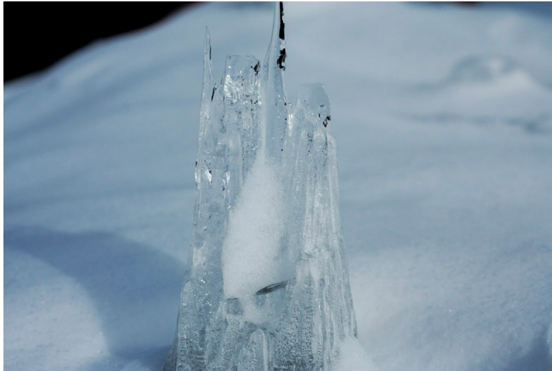
Kuva 6. Kuvateksti: Corona (Kruunu). © Winter Sid Johannesburg

Winter palasi Italiaan ja käy siellä taideyliopistoa. Hän on pitänyt jo useita näyttelyitä ja odottaa innokkaasti kesää, jolloin hän tulee vierailemaan Punkaharjulle. "Ainut huono asia on, että en pääse Suomeen talvella."