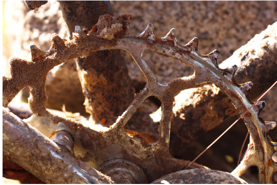
Kuva 1. Catena (Kettinki/Kahleissa).