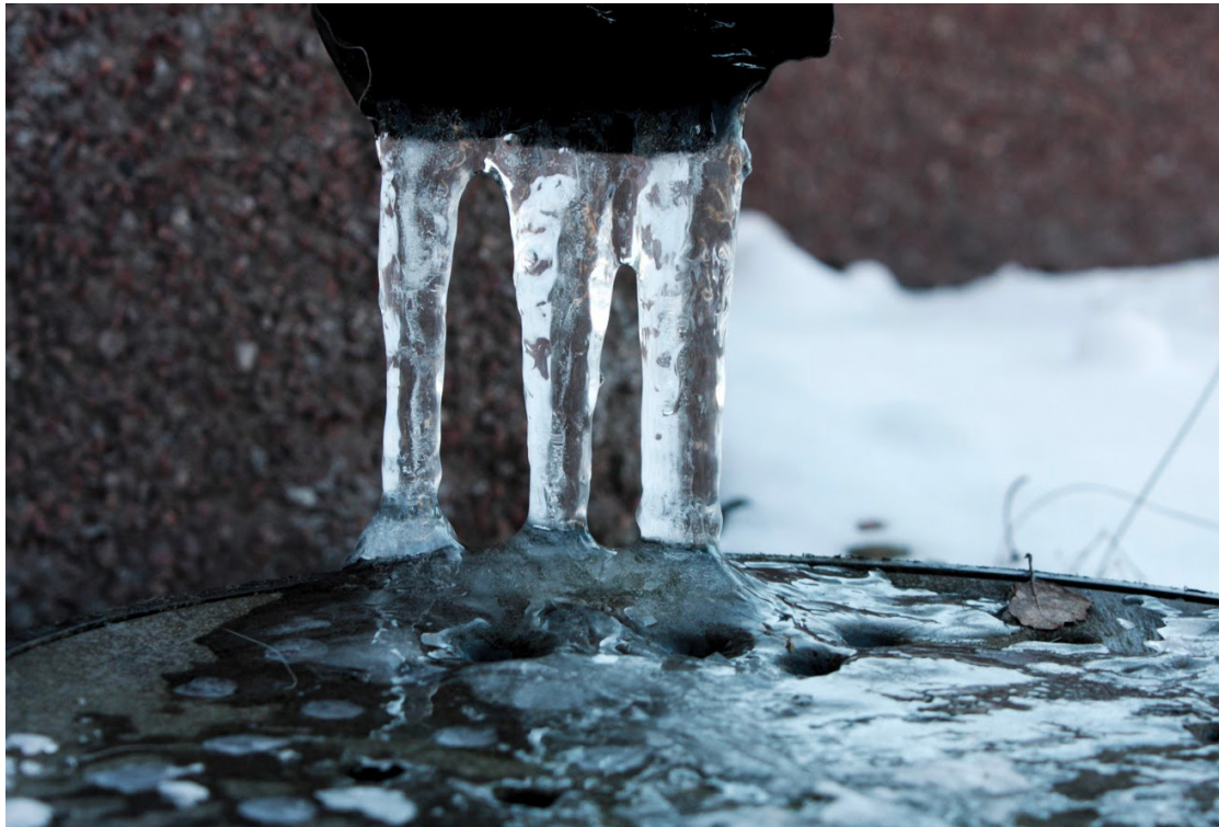
Kuva 5. Ghiaccio (Jää).

Koin olevani kuin jossain tuulimyllyssä, jossa vanhat ahdistavat tunteet törmäsivät uusiin, juuri heränneisiin vieraisiin tunteisiin. Minun piti saada tämä kaaos järjestykseen tai itseasiassa poistua tästä kaaoksesta.