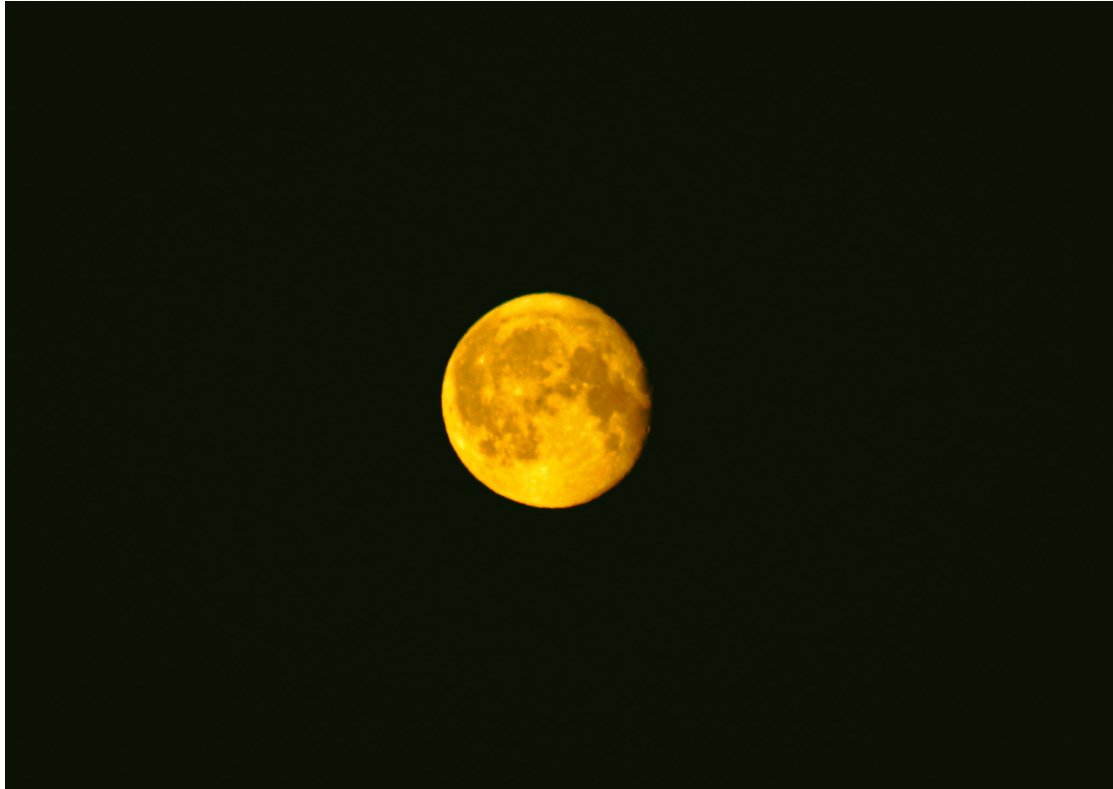
Kuva 3. Luna (Kuu). © Winter Sid Johannesburg

Jos pidämme dialogisen tilan rakentumisen yhtenä peruselementtinä turvallisuutta, sisäisen räjähdysten kaltaista kokemusta voisi tuskin pitää hyvänä lähtökohtana. Dialogisen tilan rakentaminen ei ole kuitenkaan helppoa, vaan se voi hyvinkin olla melko väkivaltainen kokemus, johon liittyy usein epävakaisuutta, moninaisuutta ja ristiriitaa (Freire 1990). Hiljaisuuden aistiminen väreilynä ja pimeyden läpi siivilöityvä valo loivat ennenkokemattoman, epäloogisen todellisuuden kokemuksen, joka ikään kuin valmisti Winterin arvaamattomalle, intensiiviselle kohtaamiselle. Tämä hetki on ikuistettu pelkistetysti raamitettuun suurikoiseen valokuvaan, joka oli asetettu Winterin valokuvanäyttelyssä kaikkein korkeimmalle paikalle keskelle näyttelysalia. Majesteettinen täysikuu kumottaa yksin yötaivaalla seuraten näyttelyvieraita salissa. Kuun kohtaaminen syksyn sateiden pieksämällä pellonreunalla oli käänteentekevä kokemus Winterille: ”Tunsin itseni nähdyksi.”