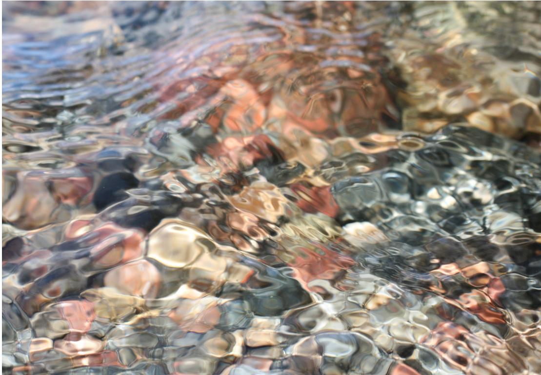
Kuva 4. L'estatte (Kesä). © Winter Sid Johannesburg

Jos tarkoituksena on löytää uudenlaisia tapoja ajatella ja toimia, aidon dialogisen tilan muodostuminen vaatii avautumista, mikä itsessään vaatii riskinottoa. "Sisäisen räjähdysten" turvallinen kokeminen kuvaa hyvin dialogisen tilan paradoksaalisuutta: Winter joutui äkillisesti kohtaamaan jotakin, mikä rikkoi hänen sisäisen negatiivisen monologinsa. Hän joutui antautumaan oman sisäisen kokemuksensa vietäväksi: "Tässä hetkessä ymmärsin kohtaanani jotakin itsestäni. Katselin Suomen täysikuuta ja ajattelin thaimaalaista isoisääni. En osaa kuvata sitä tunnetta ... jokin ... kuten eheys. Niin, eheys hetkellisesti." Winterin ensimmäisenä iltana Punkaharjulla kokemat hiljaisuus, pimeys, täysikuu ja muisto isoisästä loivat dialogisen tilan: yhteyden hetken.