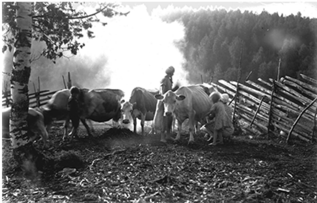
Lehmisavuilla. Ihmisiä karjalaisen kulttuuri- ja luonnonympäristön rajapinnoilla. Kuva: Pielisen museo, 1930-luku.

ulkomuseot olivat 1970-luvulla luodun ranskalaisen ekomuseoidean esikuvina. Paikalleen museoiminen yleistyi Suomessa 1960-luvulla, jolloin alettiin yleisesti museoida agraarisia kohteita vuonna 1909 ulkomuseona avautuneen Helsingin Seurasaaressa ulkomuseon mallin mukaisesti. (Vilkuna 2007, 25–26.) Suomen toiseksi suurimmaksi ulkoilmamuseoksi itseään kutsuu Lieksanjoen varrella lähellä Kolin kansallispuistoa sijaitseva Pielisen museo. Alueelle, jonka kokoaminen aloitettiin vuonna 1963, on kerätty yli 70 vanhaa rakennusta. Museo on ottanut kestävän kehityksen perusteet toimintansa ohjenuoraksi pyrkien suojelemaan paikallista kulttuuri- ja luonnonperintöä. Vanhan rakennus- ja metsätyöperinteen säilyttämisen ja esittelemisen avulla pyritään tuomaan konkreettisia välineitä myös kestävään puurakentamiseen. Vanhan rakennusperinteen välittämiseen keskittyy myös Murtovaaran talomuseo, vanha kruunumetsätorppa Valtimolla. (Vihreä museo -kysely 2017.)