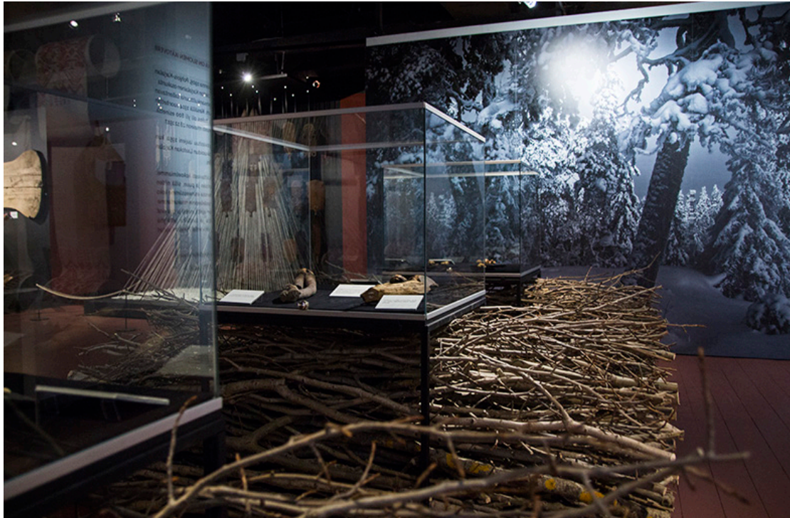
Luontoa museotilassa. Pohjois-Karjalan museon Juuret pystymetässä -juhlanäyttely perustui puuhun, puunkäyttöön ja pohjoiskarjalaisten metsäsuhteeseen.

Osittain metsien vähäisyys aluemuseoiden näyttelyissä selittyy työnjaolla. Suomalaiset museot ovat jakaneet dokumentointi- ja tallennusvastuutaan vuonna 2009 perustetun tallennus- ja kokoelmayhteistyöverkoston työjakosopimusten pohjalta, mikä välillisesti ohjaa myös museoiden näyttelytoimintaa. 24 Luontoteeman ja metsäkultuurin tallennusta hoitaa pääosin Itä-Savossa sijaitseva, vuonna 1994 perustettu metsämuseo Lusto. Museon perustamispaikaksi oli ehdolla monia paikkakuntia, näiden joukossa Joensuu, mutta lopulta paikaksi valikoitui Metsä-Suomea edustava Punkaharju, jolla on kansallismaisemastatus. Vaikka Luston painopiste on ollut metsätyössä, nähdään metsäkultturi museossa laajasti, ja suomalainen metsäsuhde on myös hyväksytty kansalliselle elävän kulttuuriperinnön listalle. (Haastattelu 2.) Metsäkultturia koskevaa aineistoa omaavien museoiden kesken on perustettu vuonna 2003 Kantapuukonsortio, johon kuuluvat Itä-Suomen alueelta Luston lisäksi pohjoiskarjalalaiset Pielisen museo, Nurmeksen museo ja Ilomantsin museosäätiö. 25