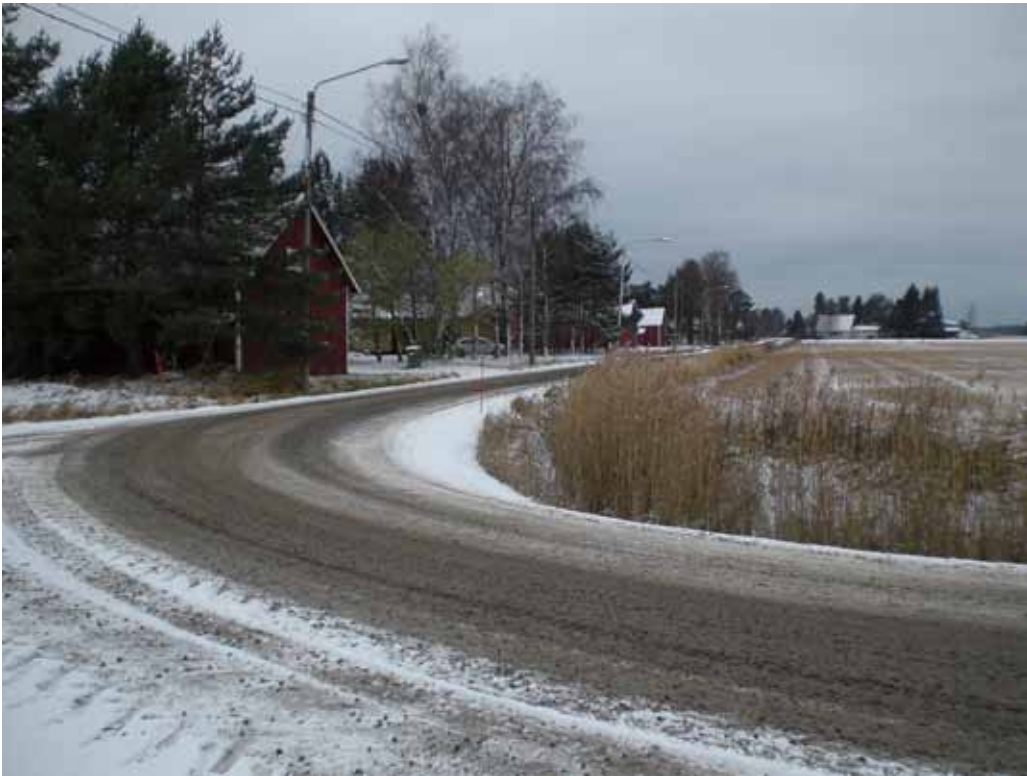
Valokuva Pitkänlinjan itäpäästä.

Talot olivat lautarakenteisia. Vielä meidänkin tullessamme sisäseinätkin olivat paljasta maalaamatonta lautta, samoin talon jo harmaantunut ulkopuoli. Jotkut taloista olivat toistensa peilikuvia. Taloissa oli avokuisti. Eteisestä meni ovi tupaan ja toinen ovi keittiöön, josta oli ainakin kahden tavallisen oven kokoinen aukko tupaan. Tuvassa oli leivinuuni, jonka perä antoi eteiseen. Eteisestä meni ovi pienempään kamariin, josta oli myös käynti isompaan kamariin. Tuvasta pääsi myös isompaan kamariin. Pienemmässä kamarissa oli lämmön lähteenä Rosenlewin valmistama Porin Matti. Se antoi nimensä useissa perheissä koko kamarille. Koko huonetta nimitettiin Porinmatiksi. Isommassa kamarissa oli pyöreä, pellillä päällystetty pystyuuni. Eteisestä johti ovi myös ullakolle johtavaan portaikkoon. Siellä ei alkuun ollut huoneita. Vintin rappujen alle johti vielä ovi, josta aikanaan meillä mentiin talon alle rakennettuun kellariin. Taloissa oli kaksi savupiippua katolla. Toisen kautta kulkivat keittiön ja tuvan savut ja toisen kautta kamarien. (Nainen, s. 1933, Hiitola.)