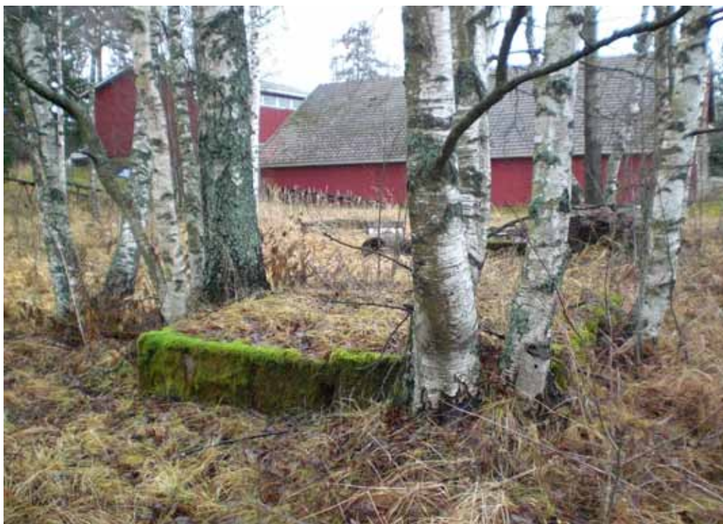
Parakkien perustuksia Sonnimäen metsikössä.