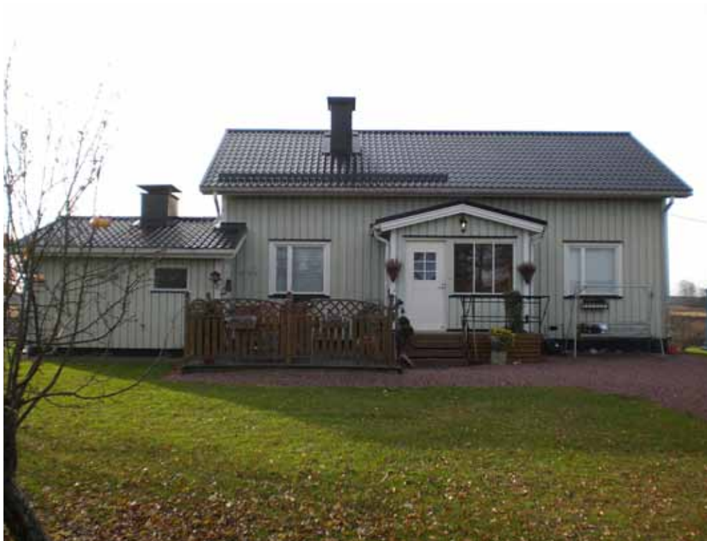
Pinomäen ruotsalaistaloja nykyasuissaan.

omaan kotiin, pois toisten nurkista: ”ja oli enemmän tilaa, vaikka elämä olikin alkuvuosina puutteellista” (Nainen, s. 1933, Hiitola). Lahjataloja pidettiin myös perinteisen suomalaisen puutalon tyylinä ja kauniimpina kuin niin sanottuja rintamamiestaloja. Pinomäen muutosta kuvattiin kertomalla rakennuksista: