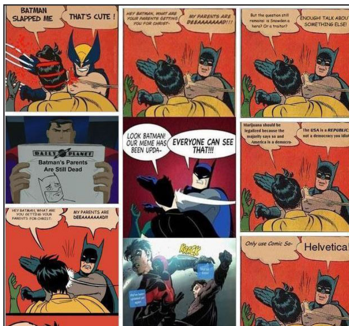
Batman slapping Robin -meemeissä läpsitään milloin minkäkin asian puolesta tai asiaa vastaan.