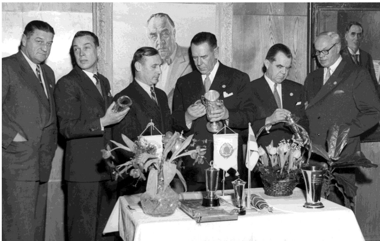
Kuva 3. Jääkiekkovaikuttajia 1950-luvun puolivälissä.

Jääkiekon kannalta vaurastuminen tarkoitti ensisijaisesti mahdollisuuksia kamppailla luonnonolosuhteita vastaan. Ensivaiheessa unelma konkretisoitui 1950-luvulla tekojääratojen muodossa. Nyt otteluita ja pelikausia ei jouduttu enää perumaan jääkiekolle epäedullisten sääolosuhteiden takia.