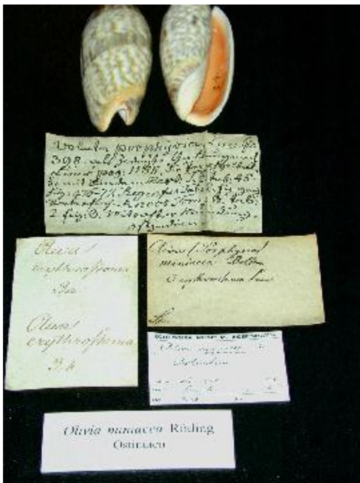
Kuva 4 Oliva miniacea Röding, kotilo. Kotilo ja sen säilynyt historiallinen merkitysverkosto. (Helola 2003).

Kokoelmassa eläinnäyte voi myös muuttua niin, että siitä tulee näyte- tai tutkimusineeksi kelpaamaton. Näyte voi rapistua niin huonokuntoiseksi, että sitä ei voida enää käyttää tutkimus- tai näyttelyesineenä. Tällaiset näytteet voidaan poistaa kokoelmasta, mutta poistaminen on hyvin harvinaista ellei kyseessä ole esimerkiksi museon muutto uusiin tiloihin tai vaikea tilanpuute. Poisto voidaan toimittaa esimerkiksi näytteitä myymällä, jolloin ne jatkavat elämäänsä esimerkiksi koriste-esineinä. Rapistunutkin näyte voidaan säilyttää museossa, mikäli sillä on historiallista arvoa: tällöin näyte muuttuu eläintieteellisestä näytteestä historialliseksi näytteeksi. Näyte voi muuttua historialliseksi näytteeksi paradigman murroksen vuoksi: näin on