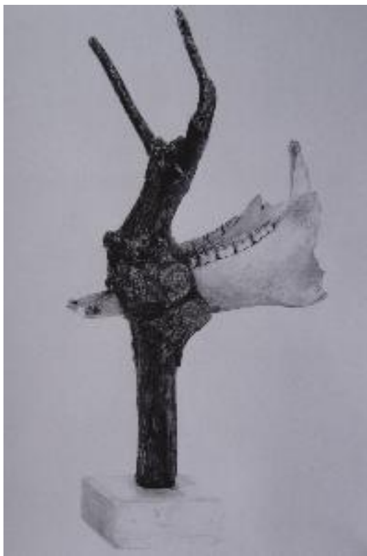
Kuva 2 ZMUC Leukaluu, kasvanut puun juuren sisään. Hevonen (Equus caballus, Perissodactyla). Juuren korkeus: 62 cm. Näytteen merkitysverkostoa ei ole illustroitu. Verrattæassa valokuvaa kuparipiirroksen (Kuva 3) voidaan havaita näytettä muokatun kiinnittämällä se uudenslaiselle jalustalle. (Kööpenhaminan yliopiston eläintietæellinen museo)

on luonnossa luonnollisessa prosessissa muodostunut objekti, eli se ei oudosta rakenteestaan huolimatta ole väärennös.