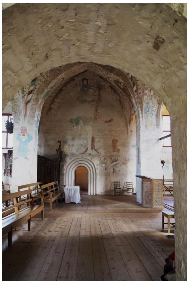
Keskiajalla pyhän Kristoforoksen kuvan näkemisen uskottiin suojelevan äkkikuolemalta. Kristoforos on kuvattu esimerkiksi Hattulan Pyhän ristin kirkon pohjoisseinälle, mistä sen näkee ensimmäisenä asiana kirkkoon astuessaan.

Sen lisäksi, että väitöskirjani tuo esiin kirkon ideaalin yksityisestä kuolinhetkestä, tutkimukseni täyttää myöhäiskeskiaikaisen kuolinhetken yhteisöllisyyteen liittyvän toisen tutkimusaukon. Siinä missä aikaisempi tutkimus on jo todennut kuolinhetken olleen yhteisöllinen tilanne keskiajalla, väitöskirjani vastaa kysymykseen, miten tätä yhteisöllisyyttä luotiin kuolevan ympärille 1400-luvulla. Väitöskirjassani vastaan tähän kysymykseen italialaisiin ja ruotsalaisiin kanonisaatioprosesseihin ja ihmekokelmiin tallennettujen kuolleistaheräämisihmeiden kautta. Tällaista hagiografista aineistoa on aikaisemmin käytetty varsin vähän kuolemantutkimuksessa. Sen vuoksi väitöskirjani tarjoaa uuden lähestymistavan tutkia keskiaikaisen yhteisön tapoja luoda yhteisöllisyyttä kuolinhetken koittaessa.